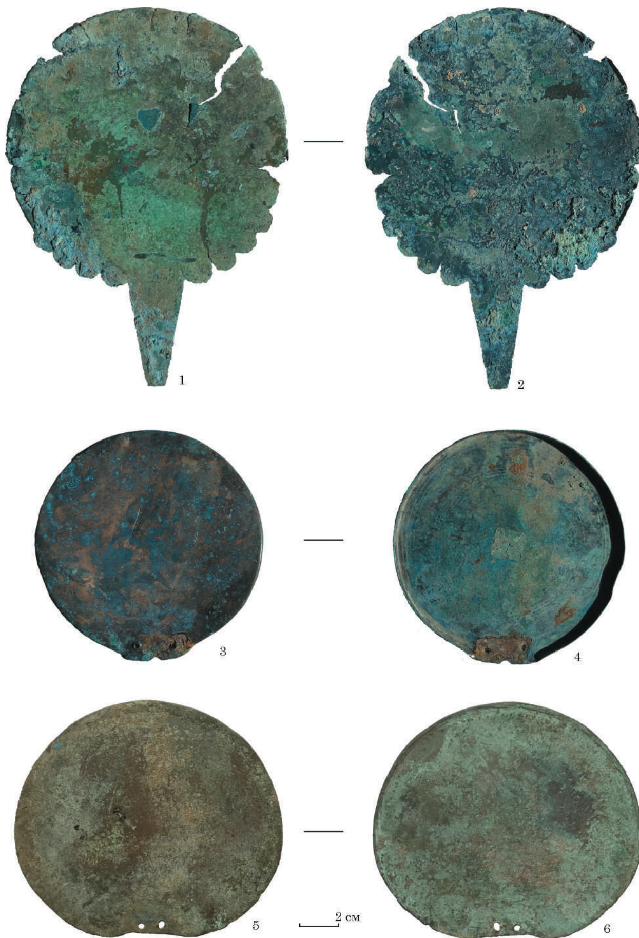
Рис. 2. Бронзові дзеркала зі станиць: 1—4 — Чамликська; 5, 6 — Вознесенська