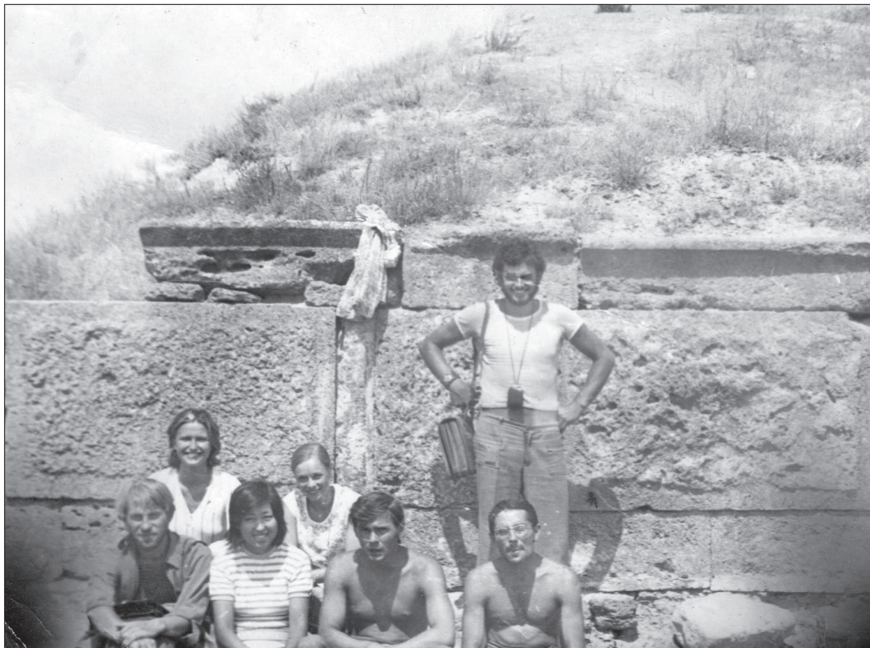
У гостях в Ольвії у Краснознаменської експедиції, 1974 р.