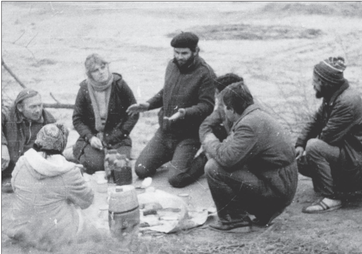
Відпочинок членів експедиції «Гіпаніс» у Заячій Балці, 1984 р.