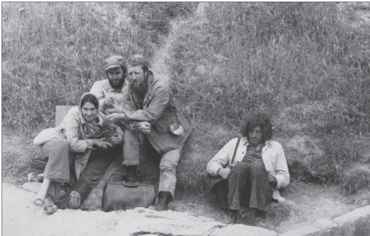
На кургані біля села Облої, Краснознаменська експедиція, 1978 р.