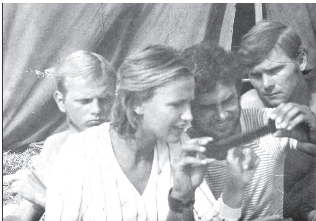
У таборі Краснознаменської експедиції, 1974 р.