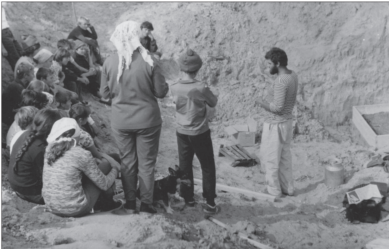
Екскурсія для місцевого населення біля поховання скіфського воїна, с. Бехтери, 1983 р.