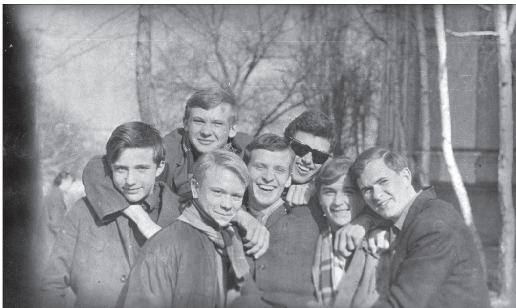
З однокласниками біля школи № 2 м. Чернігів, весна 1969 р.