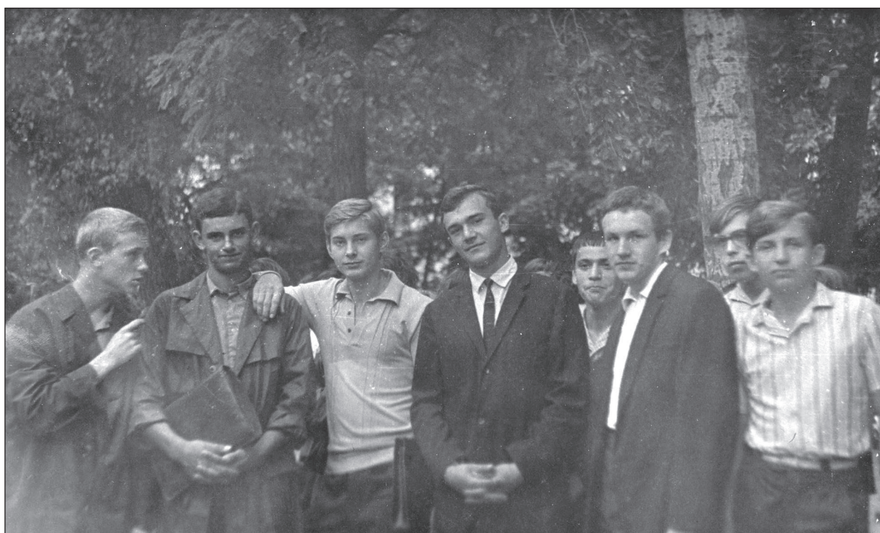
У вересні 1969 р. з однокласниками у Чернігові