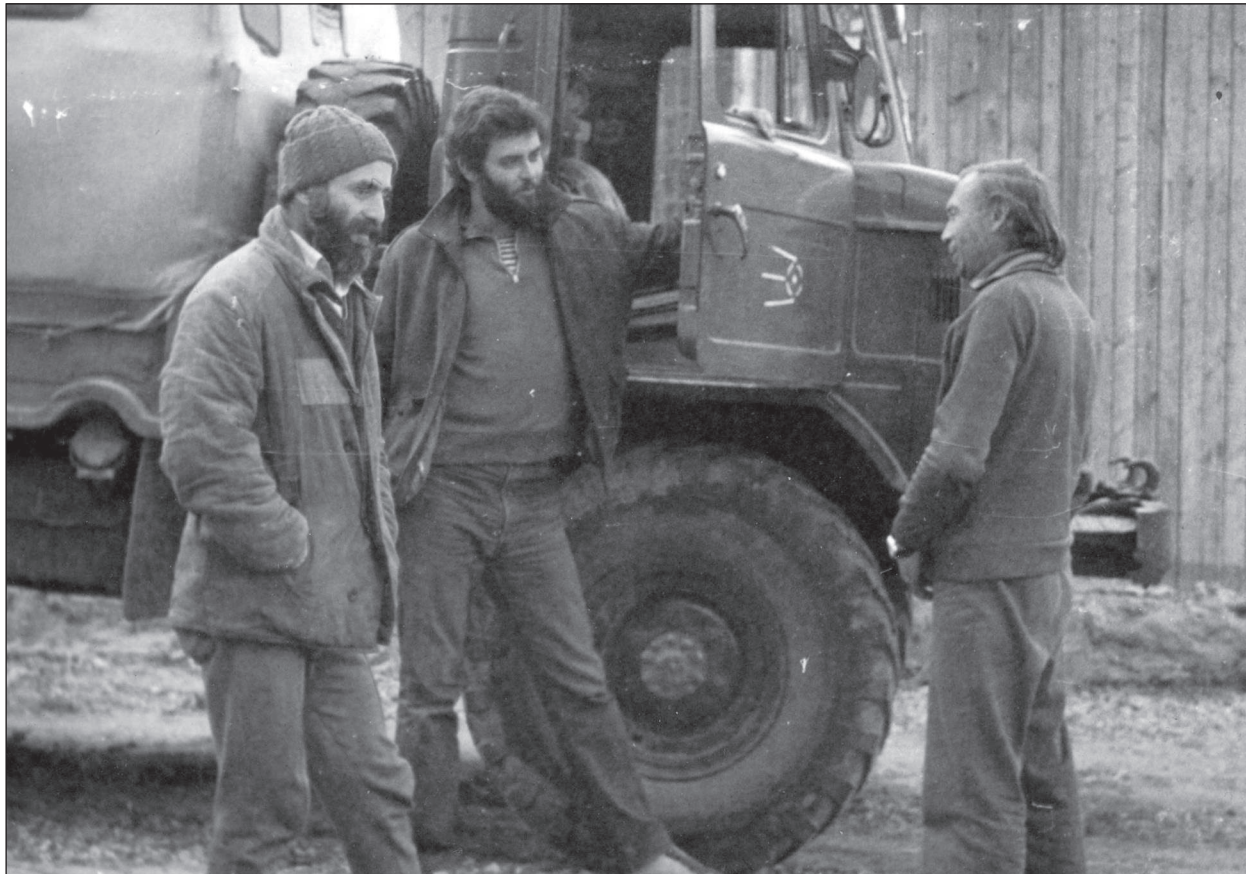
Ольвія, експедиція «Гіпаніс», 1984 р.