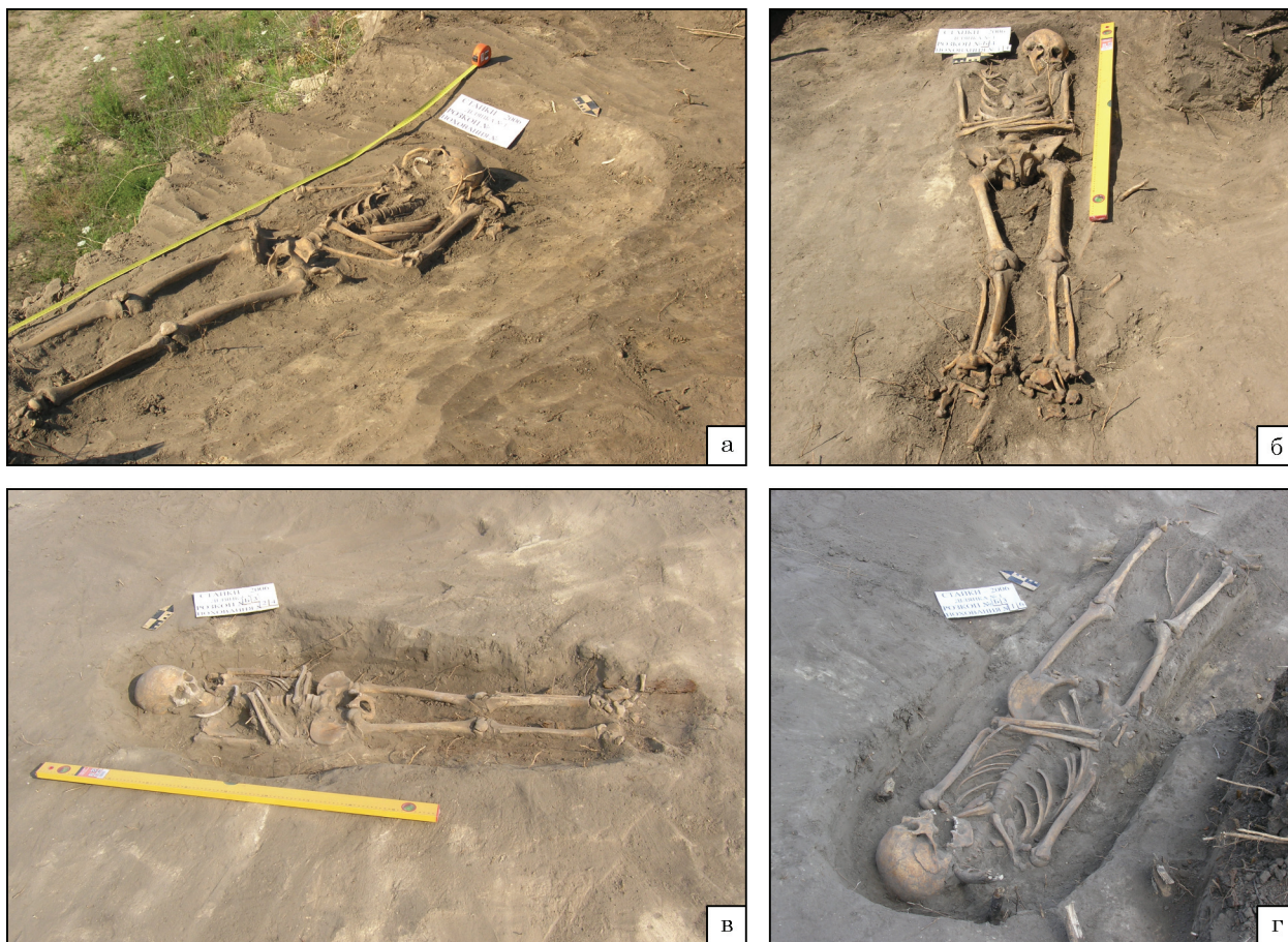
Рис. 5. Фото поховань із розкопаної ділянки могильника періоду козацтва у Стайках: а — № 1, вигляд з північного сходу; б — № 14, вигляд зі сходу; в — № 24, вигляд з південного сходу; г — № 16, вигляд із заходу

ноземі заповнення могильної ями не читалось. Безпосередньо під кістяком на глибині 1,00 м були виявлені згадані нумізматичні знахідки, що виступили хронологічним репером дослідженої у 2006 р. ділянки кладовища.