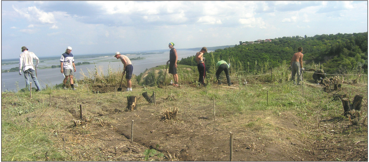
Рис. 4. Робочий момент початку стаціонарних досліджень пам'ятки