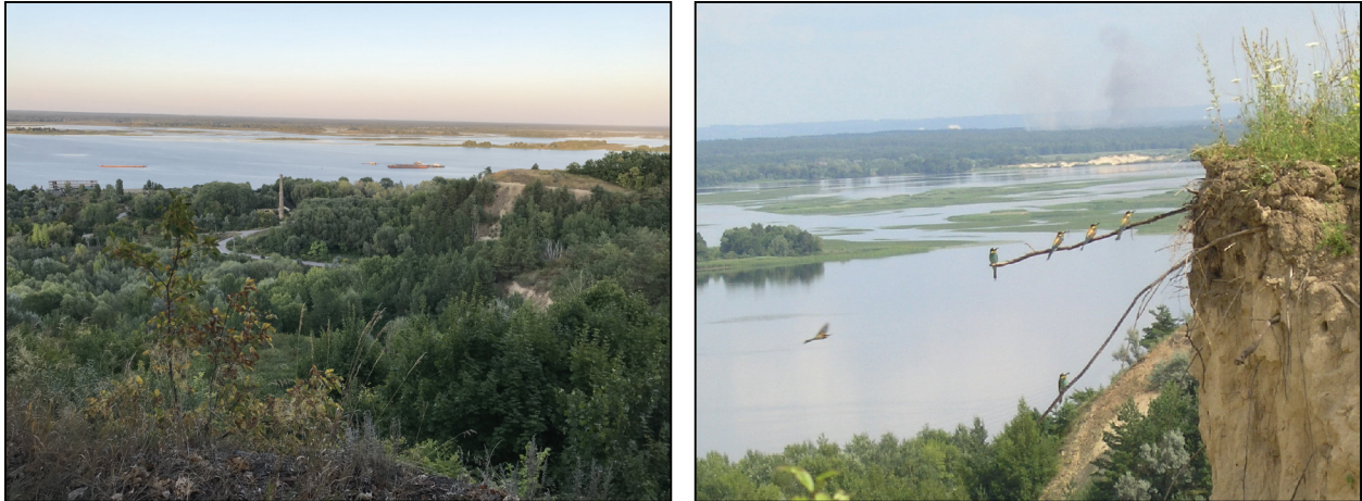
Рис. 6. Вигляд зі вцілілої ділянки пам'ятки на Канівське водосховище та панораму Лівобережжя

як демонструють наведені характеристики дослідженої ділянки кладовища, не дали підстав для формулювання висновків щодо певних закономірностей у розташуванні могил цього цвинтаря. Водночас, у центральній частині розкопу Б-3 простежена певна концентрація поховань, зокрема й з наведеними прикладами часткового перекривання за наявності на незначній відстані незайнятих територій. Не виключено, що описаний випадок вказує на існування у складі кладовища окремих ділянок, які належали одній родині або близьким родичам.