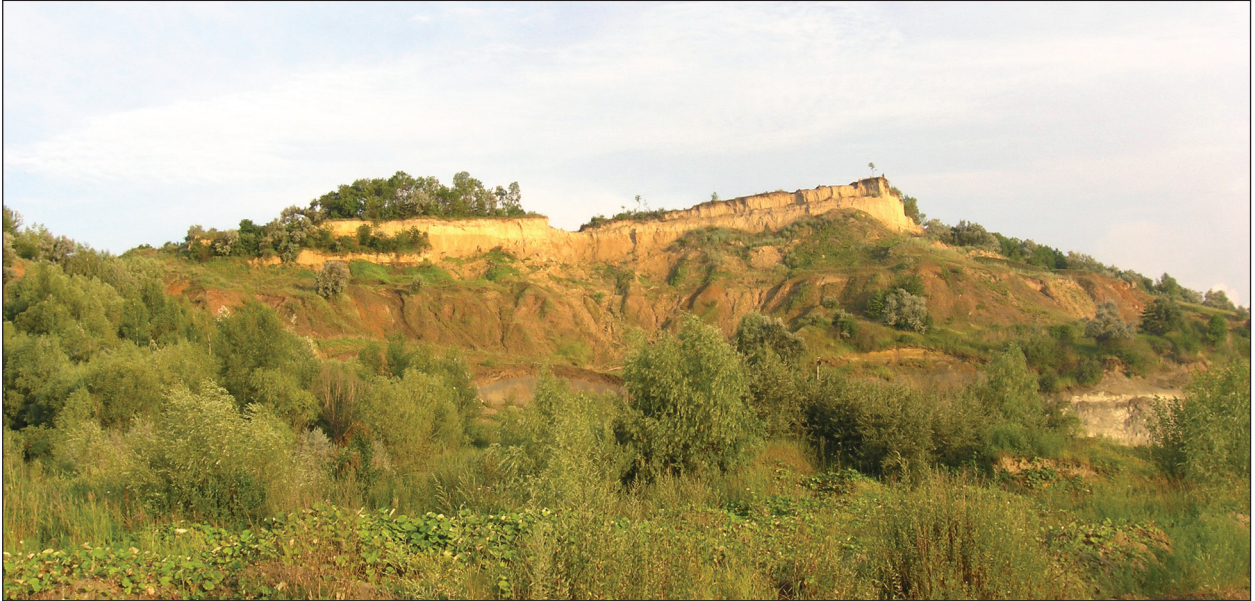
Рис. 2. Вціліла частина багатошарового поселення й могильника козацької доби Стайки 1, вигляд зі сходу

напрямку села Юшки ) (Антонович 1895, с. 26), що наведене і згодом (Шендрік 1977, с. 66, 67). А розміщення згаданого перекритого могильником селища на відокремленому від основного масиву плато балкою панівному узвишші, як уже відзначалось, дозволяє вбачати певні паралелі з городищем «у напрямку Койлова», враховуючи, що останній, хоч і перебував на протилежному боці Дніпра, міг слугувати, особливо до створення водосховища, доволі зручним орієнтиром (Петраускас, Готун, Квітницький 2007, с. 303). Водночас, на краю берега Дніпра за півкілометра вище за течією від дослідженого осередку розташований Новгород Святополч — південне Витачівське городище, локалізація якого теж відповідає «койловському» напрямку. Тому достеменно з пам'яткою на території кар'єру у Стайках варто пов'язувати поселення на береговому останці за 1 км на північ від села, описане за результатами розвідки Н. М. Кравченко, О. В. Петраускаса і Р. Г. Шишкіна (Кравченко, Петраускас, Шишкін 1985—1986/134, с. 25, 26) і включене до різних довідкових видань з археології регіону (Петрашенко, Козюба 1999, с. 35, 36; Овчинников, Квітницький 2004, с. 620).