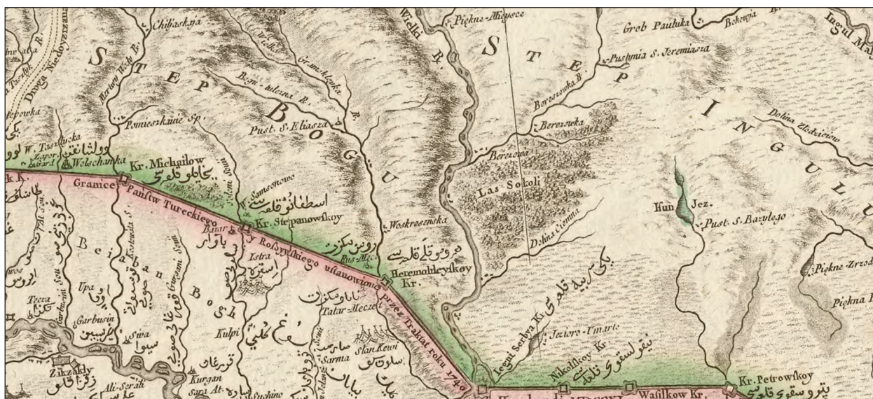
Рис. 5. Інгульський і Бугський степ на карті Річчі-Занноні 1767 р. (за Ricci-Zannoni 1772)

показано Бугський степ, а між Інгулом і Інгульцем — Інгульський (рис. 5; Ricci-Zannoni 1772, р. 24). Тому видається, що в степах між Бугом і Інгулом перебувала одна орда, а між Інгулом і Дніпром інша (або кілька). Іноді на картах середньовічна назва «boristene» (та її варіанти) показана в районі р. Інгул, яка впадає в Бугський лиман у районі сучасного Миколаєва (Гордеев, Терещенко 2017, с. 371).