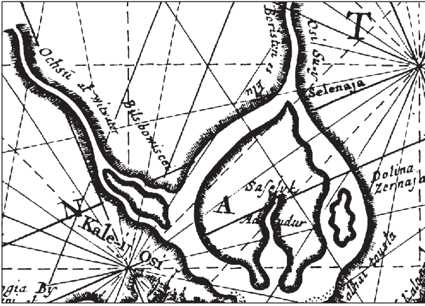
Рис. 1. Південний Буг на карті Н. Вітсена (за Witsen 1705)