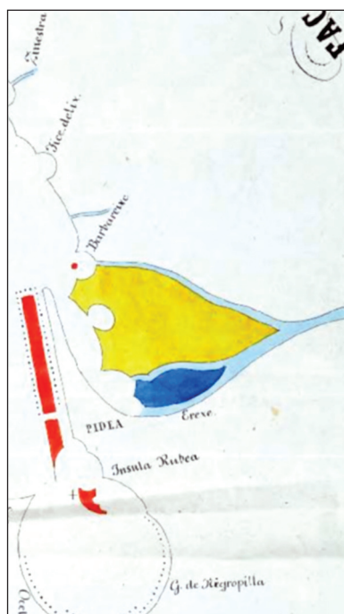
Рис. 4. Узбережжя Чорного моря в районі гирл Дніпра і Південного Бугу на карті 1351 р. (за Serristori 1856)