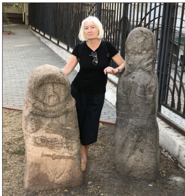
Кропивницький, зі скифськими стелами біля музею, 2019 р.