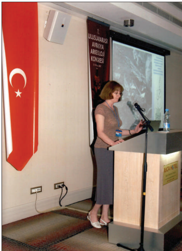
Виступ на археологічному конгресі в Ілці (Туреччина), 2007 р.