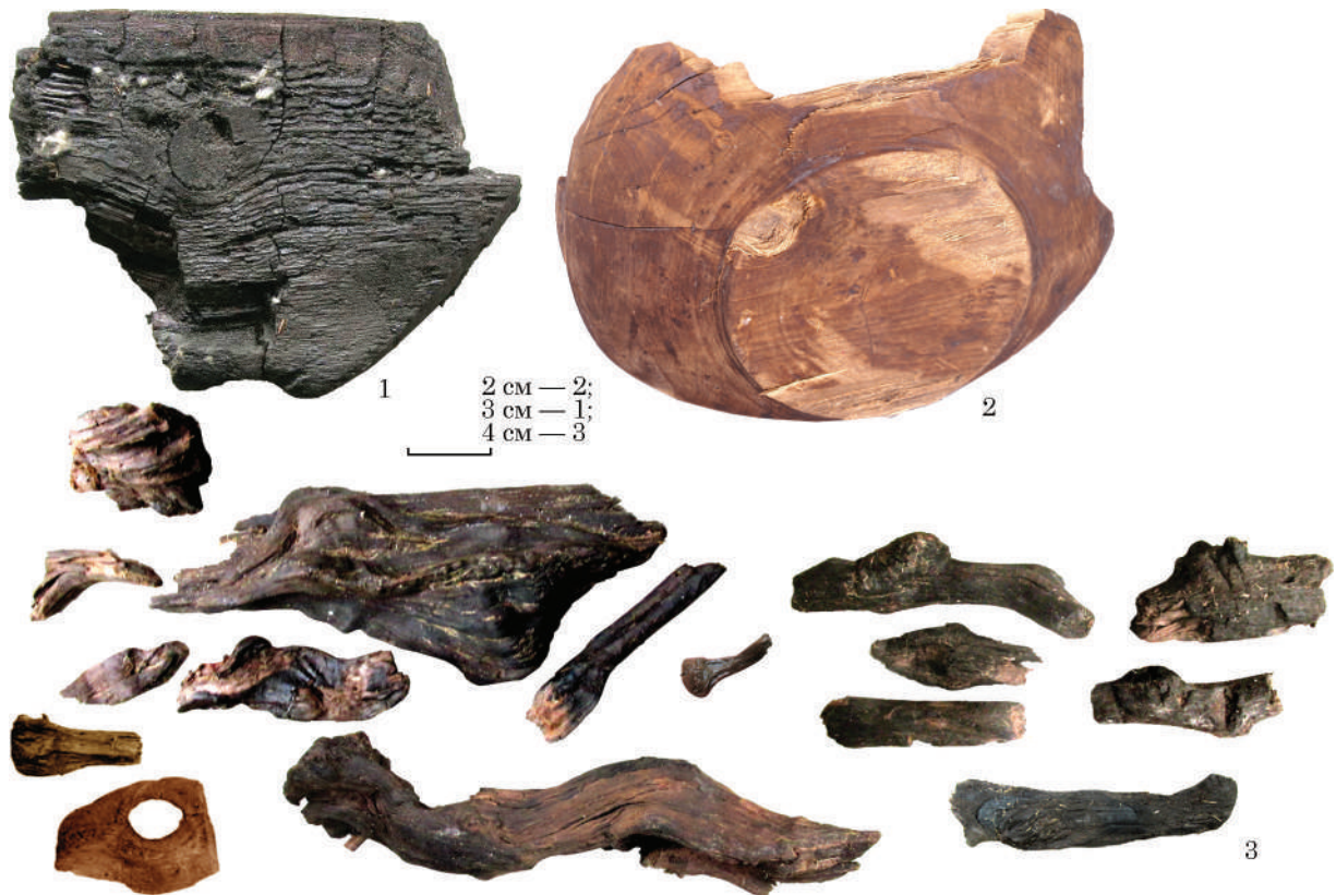
Рис. 1. Дефекти деревини: 1, 2 — затесані сучки на виробах (1 — дно бочки, Воїнська Гребля; 2 — дно чаші, Київ, Поділ); 3 — фрагменти відбракованої деревини, яка не підлягала обробці, Ходосівка-Рославське

Діагностика деревини решток бондарних виробів продемонструвала повну перевагу сосни як сировини для бондарства, а ліщини і верби — для дерев'яних обручів (докладно див.: Сергеева 2014а). Серед хатнього начиння найбільш вивченим є посуд, який демонструє сталі традиції у виборі вихідного матеріалу. Це липа і клен для видовбаних гарних контейнерів, клен і — на другому місці — ясен для точеного столового посуду. Інші породи використовувалися значно рідше (додаток 3). Зазначимо, що інші виявлені точені вироби, виготовлені винятково з клену. Близькі аналоги щодо використання клену простежуються серед новгородських матеріалів (Колчин 1968, табл. I). Чотири проаналізовані прядильні гребені (додаток 3) виготовлені з різної деревини: клену (Воїнська Гребля, Манжелія), берези (Софіївська Борщагівка), груші (Райковецьке городище). Перевага зазначених порід для виготовлення прядильних гребенів цілком відповідає пізнішій традиції слов'янських народів Східної Європи. Загалом у випадках, коли є можливість вивчення матеріалу виготовлення серії виробів одного типу продукції, простежується, що давньоруські деревообробники демонструють добру обізнаність з властивостями тієї чи іншої деревини і користуються ними (Сергеева 2016; 2017).