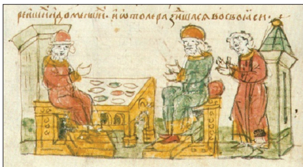
Рис. 2. Гривни на мініятурі Радзивиллівського літопису (за: Радзивиловская... 1994)

існували різні пріоритети у використанні тих чи інших загальних еквівалентів, обумовлених власними природними та людськими ресурсами. Не могла бути й однаковою вартість одиниць хутра, м'яса чи меду в кількох десятках окремих держав Східної Європи XII—XIII ст. Також і базове посилання на відповідність руської куни дирхемові, виходячи з вартості: один дирхем — хутро куниці (що фіксується за окремими джерелами), не може розглядатися універсальним для усіх земель і князівств Східної Європи (Назаренко 1996, с. 53—55).