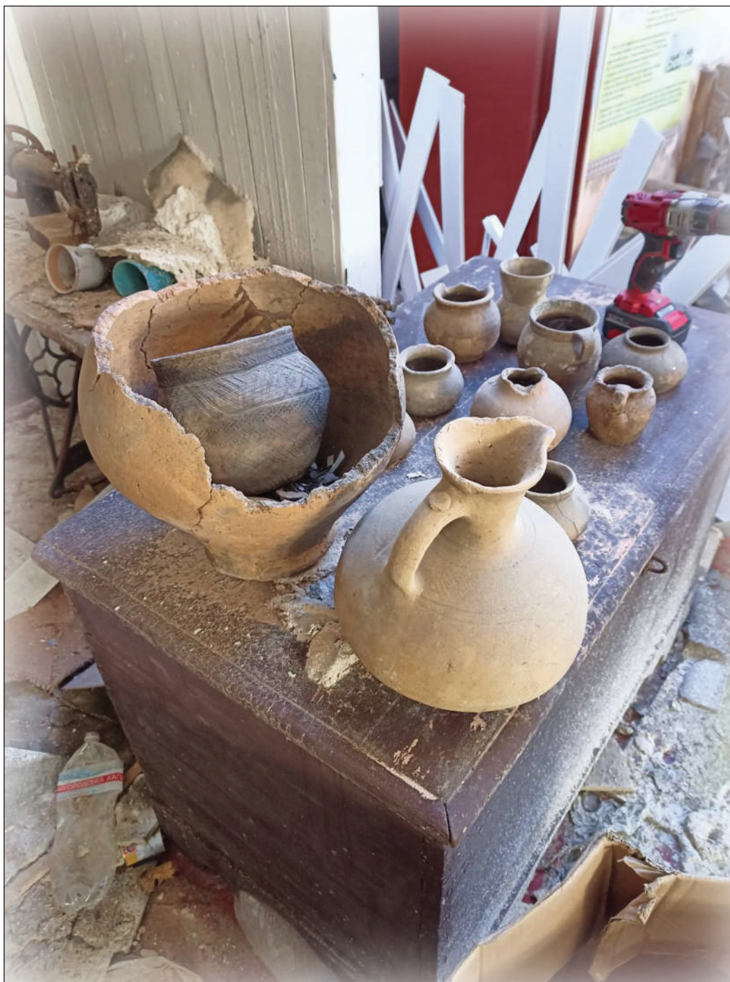
Рис. 4. Посудини, які були вилучені з розбитих вітрин музею

у принципах формування музейної мережі. Нам здається, що відбудова історико-археологічного музею-заповідника «Верхній Салтів» у тому вигляді, в якому він існував до війни, недоцільна і неможлива, бо тут відсутня потрібна для цього інфраструктура та кваліфіковані фахівці, у тому числі і археологи, які би могли повноцінно працювати у музеї. Власне музей за місцем сво-