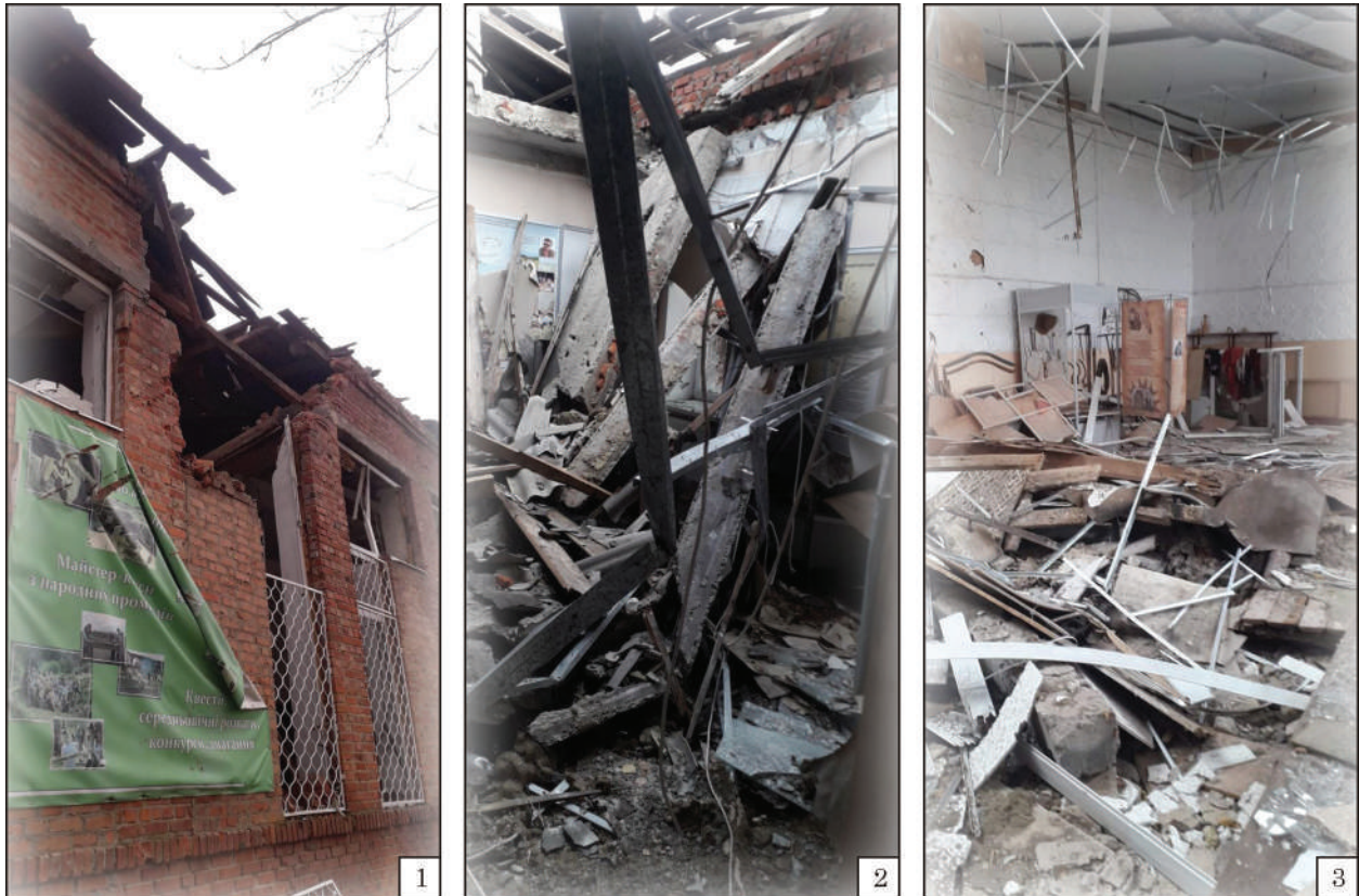
Рис. 3. Руйнування музею: 1 — фасад будинку музею на теперішній момент; 2 — один із залів археологічної; 3 — стан залу «Етнографія»

16,7 % фрагментів кераміки з групи науково-допоміжного фонду репрезентують посуд бронзової доби (переважно зрубної культури), скіфського часу, римської доби (черняхівської культури), доби раннього середньовіччя (пеньківської культури). Якщо фрагменти керамічних виробів доби козаччини та салтівської культури походять безпосередньо з території Верхньо-Салтівського городища, яке знаходиться під городами місцевих мешканців, то фрагменти посудин інших історичних періодів та археологічних культур, вірогідно, були зібрані десь в інших місцях Харківщини (Аксьонов 2023, с. 176).