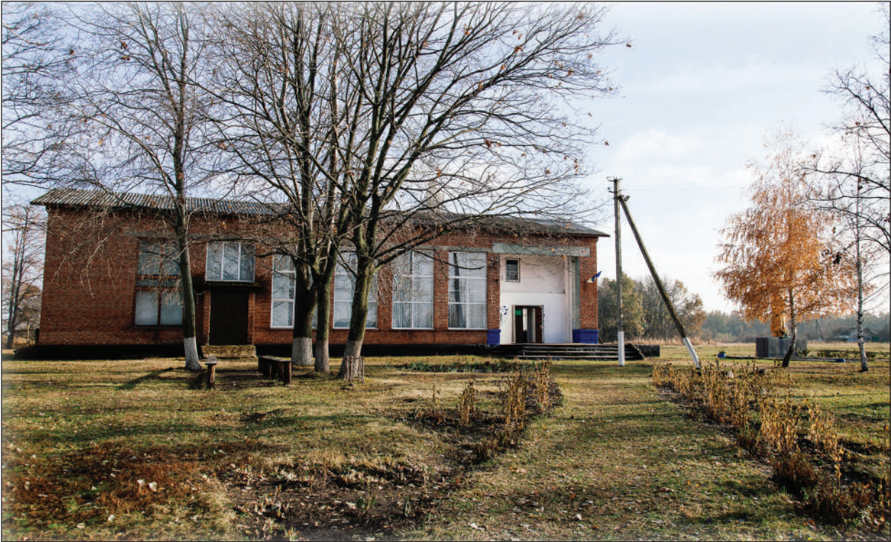
Рис. 2. Будинок музею до війни (колишній клуб с. Верхній Салтів)

той факт, що на ВСМ I та ВСМ III залишився не дослідженим простір між дромосами катакомб, іноді доволі значний, де могли знаходитися окремі ями поховання та тризни. Звітна документація В. Г. Бородуліна відрізняється в кращій бік від документації В. О. Бабенка, бо вона зроблена відповідно з вимогами Інституту археології радянського періоду, проте і вона не є досконало (описи поховальних споруд та комплексів дано іноді занадто стисло; у більшості випадків відсутні малюнки речей, котрі замінені фотографіями, іноді, поганої якості; креслення поховальних споруд виконано доволі схематично). Головним недоліком у роботі В. Г. Бородуліна було те, що він зовсім не цікавився інтерпретацією та введенням до наукового обігу отриманого матеріалу. Його публікації матеріалів розкопок мали характер стислих повідомлень (Бородулін, Пархоменко 1986; Бородулін 1988). Матеріали розкопок В. Г. Бородуліна поповнили фонди Харківського історичного музею 1 .