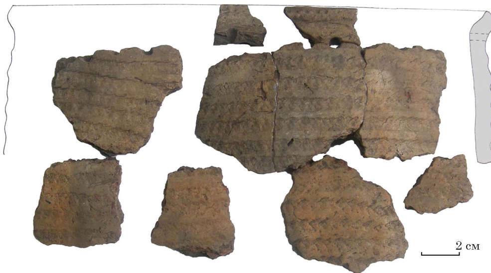
Рис. 5. Реконструкція верхньої частини горщика. Глина, ліплення, вдавнення. Клюсівка, ур. Татарський бугор. Тип Засуха. Розкопки О. Коваленко. НМЗУГ, інв. № НДА 16390, 16551, 16548

Орнаментация цієї групи така: під краєм вінця не наскрізні проколи, що з внутрішнього боку утворюють невеликі «перлини» (крім того, що на рис. 8, або наскрізні проколи). Поверхня добре заглажена, до лискування.