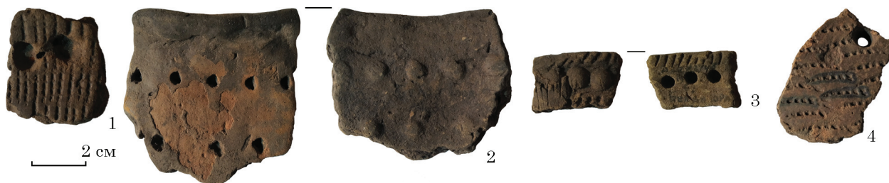
Рис. 1. Фрагменти стінок посудин. Глина, ліплення, вдавнення. Макухівка, ур. Біла гора. Тип Засуха. Розвідки Івана Післарія. ПКМВК, інв. № 1 — ПКМ 30489 А2273; 2 — ПКМ 30489 А2273; 3 — ПКМ 30489 А2273/49; 4 — ПКМ 30489 А2273