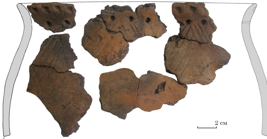
Рис. 3. Реконструкція верхньої частини горщика. Глина, ліплення, вдавнення. Клюсівка, ур. Татарський бугор. Тип Засуха. Розкопки Оксани Коваленко. НМЗУГ, інв. № НДА 17068, 15229, 17115