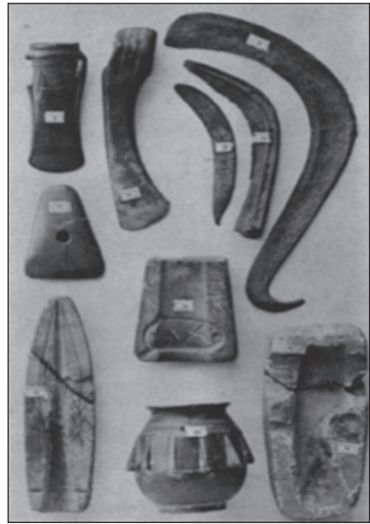
Рис. 3. Випадкові знахідки кам'яних та бронзових виробів з Черкащини. Колекція О. Бобринського (за: Бобринский 1887)