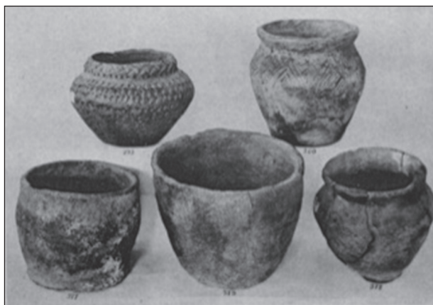
Рис. 2. Керамічний посуд із курганів доби бронзи сучасної Дніпропетровщини. Колекція О. Поля (за: Мельник 1893)

були досліджені численні могили доби ранньої бронзи з «фарбованими кістяками», а також поховання кінця середньої бронзи в с. Гречківка (Бобринский 1887, с. 61—66) та пізньої бронзи в сс. Гуляйгородок (Там само, с. 102) і Теклине (Бобринский 1901, с. 18). Також О. Бобринським були опубліковані матеріали розкопок курганів, які проводив у Пороссі та на Лівобережжі ще один дослідник — Євген Зноско-Боровський (Бобринский 1901, с. 92—144).