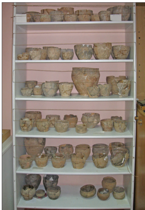
Посуд із поховань доби бронзи, розкопаних І. І. Артеменком на території Брянського Полісся (фонди Інституту історії у Мінську, 2008 р.)

Деякі наукові положення І. І. Артеменка стосовно культур пізнього бронзового віку лісової та лісостепової зон Чорноморсько-Балтійського регіону були у подальшому розвинені його учнями (В. І. Ключко) та учнями його учнів (С. Д. Лисенко). Цікава (хоч і дещо спірна) думка була висловлена у 1998 р. В. І. Ключком, стосовно формування у XVI ст. до н. е. у Середньому Подніпров'ї Лобойківського осередку металообробки: «ця металургійна традиція не укладається у традиційні концепції ані східнотшинецької, ані зрубоїдної культур. Це давнє виробництво вказує на те, що у Середньому Подніпров'ї, у другій половині II тис. до н. е. жило населення, яке своїм походженням не було пов'язане ані з Карпатським регіоном, ані зі сходом. Ближче всього до цих фактів стоїть концепція І. І. Артеменка Сосницької культури, як культури автохтонної » (Ключко 1998, с. 217, 236). Тричасна побудова І. І. Артеменком тшинецько-комарівсько-сосницької спільності була покладена в основу сучасної моделі тшинецького культурного кола (ТКК), яке складається із трьох культур — тшинецької (у басейнах річок південного та східного Балтійського регіону), комарівської (у лісостеповій зоні Північного Причорномор'я) та сосницької (у Центральному та Східному Поліссі) (Лисенко 2002; 2013). Важливим у поглядах І. І. Арте-