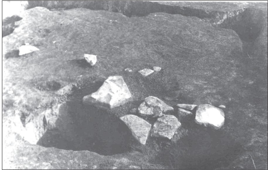
Рис. 2. Фото Кругликського об'єкту (за І. С. Винокуром) Fig. 2. Photograph of the Kruhlyk object (after I. S. Vynokur)

юча праця А. І. Мелюкової з пам'яток раннього залізного віку регіону лише щойно вийшла (Мелюкова 1958). Дослідження класичних ранньоскіфських правобережних дністровських курганів у Круглику, Долинянах (Смирнова 1968; 1977а), Перебиківцях (Смирнова 1979) були ще в майбутньому. Як у майбутньому були й дослідження експедицією Чернівецького музею та університету під керівництвом Б. О. Тимощука більшої частини курганів скіфського часу (Могилов 2010, с. 115—120). Вони незабаром були проведені у Білоусівці (Тимошук 1969, с. 36; 1974, с. 87—88), Іванівцях (Тимошук 1963, с. 1, 2) 2 , Вікні (Тимошук 1960, с. 4—6), Новосілці (Ключевой 1965, с. 38, 39; Тимошук 1974, с. 89—91) 3 . Дерев'яні склепи Середнього Подністров'я залишалися маловивченими та недостатньо проаналізованими. А стовпові ями (Sulimirski 1936, s. 7—8) чи й самі гробниці (Тимошук 1970, с. 21) нерідко інтерпретувалися як культові об'єкти. Лише у 1970-хх рр. Г. І. Смирнова на основі власних досліджень проводить переоцінку низки розкопаних раніше курганів, стверджуючи думку про масове розповсюдження стовпових дерев'яних конструкцій у курганах Західно-подільської групи (Смирнова 1977b, с. 8—10). Її висновки були масово підтверджені на пізніших матеріалах (Гуцал 2018). Сьогодні більшість поховальних комплексів регіону з масштабними слідами дії вогню трактується саме як рештки спалених дерев'яних гробниць, а ями в них — як місця кріплення вертикальних стов-