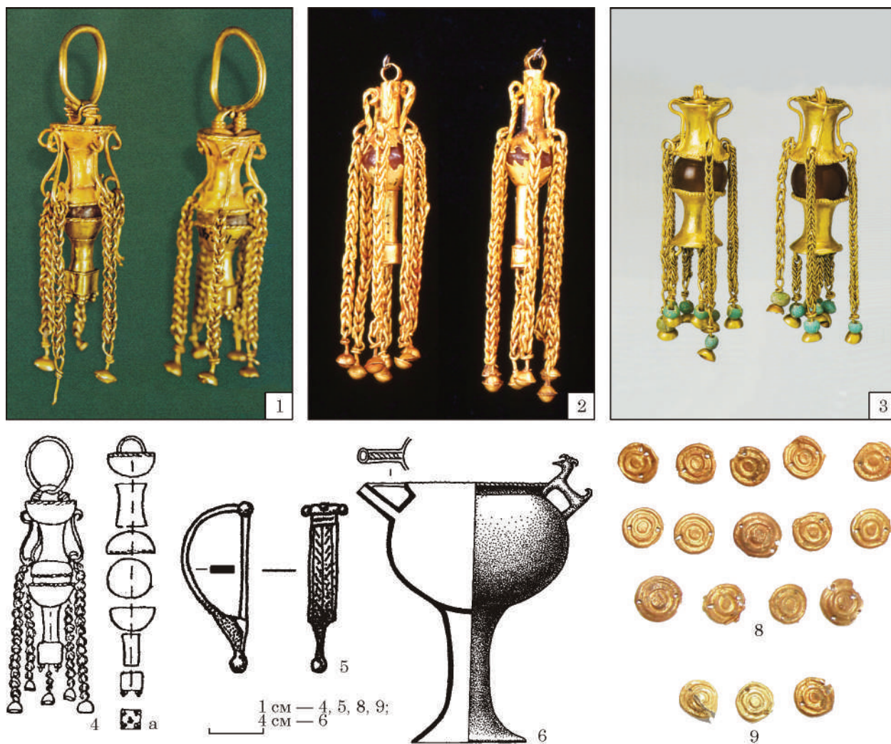
Рис. 5. Речі з комплексів Давидів Брід та Червоний Маяк: 1, 4—6 — Давидів Брід; 2 — Запруддя; 3 — Сладковський могильник (за Сокровища 2008); 7 — Червоний Маяк, поховання 128; 8 — золоті бляшки з правої руки; 9 — золоті бляшки з лівої руки