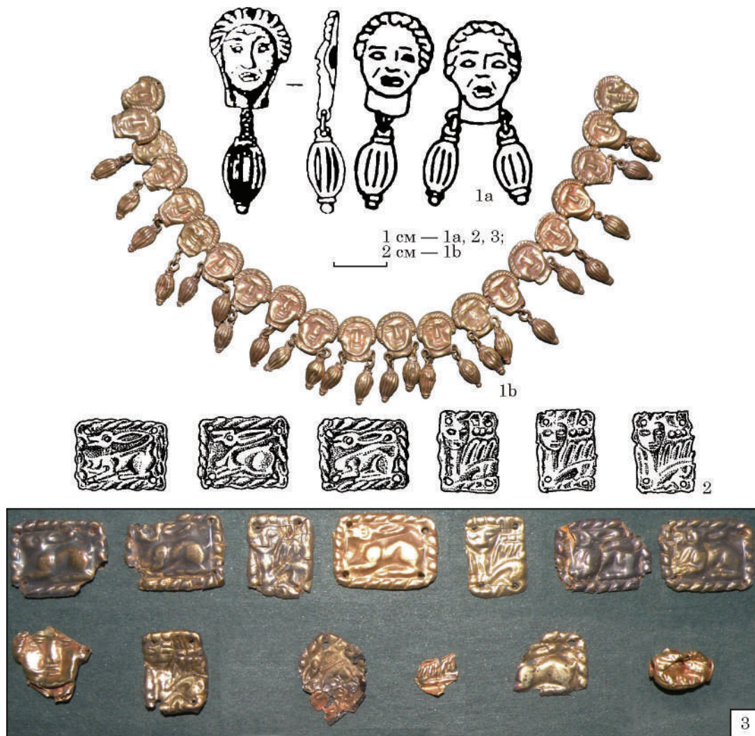
Рис. 1. Прикраси з курганів у с. Зелене (за Фіалко 2010): 1 — намисто із золотих фігурних бляшок; 2, 3 — рельєфні бляшки із фігурним зображенням