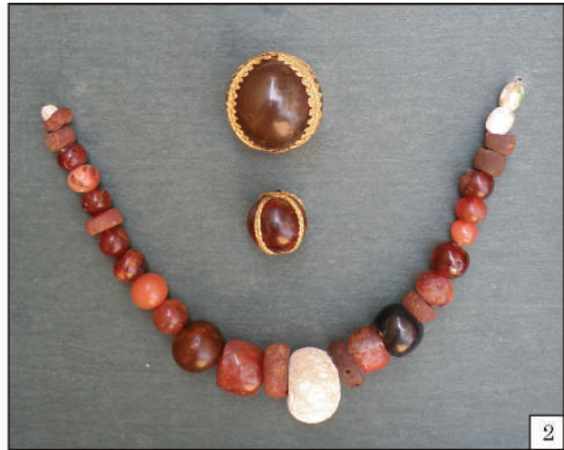
Рис. 4. Комплекс речей із с. Солонці: 1 — браслети, перстень та сережка; 2 — намисто