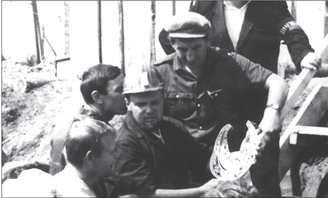
З пекторалю в руках. Товста Могила. 21 червня 1971 р.

— Пригадую Краснознаменську експедицію початку 70-х рр. минулого століття. Кургани курганами, вони в Степу, а після спекотного дня напруженої праці на нас чекали затишні будиночки пансіонату на березі моря, триразове харчування (головний принцип Є. В. — «нагодувати солдат гарячою їжею», все за статутом) та, продовжуючи військові альянзи, вільний час. Хто і як його реалізує, начальник демократично не контролював, але вранці не вийти на роботу було просто соромно.