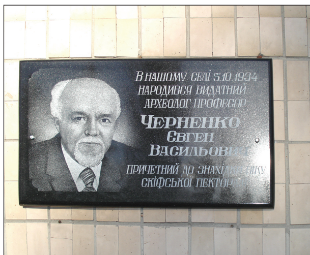
Меморіальна дошка на честь професора Євгена Черненка на батьківщині — с. Буда-Воробі Житомирської обл. 2011 р.

Дав їй на ознайомлення Є. В. Він прочитав досить швидко, кілька разів хмикнув і щось підкреслив в тексті олівцем. А далі був такий діалог.