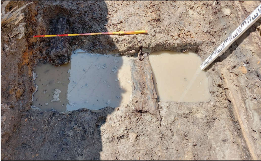
Рис. 8. Бердичів 2024. Рештки дерев'яних конструкцій в траншеї 1