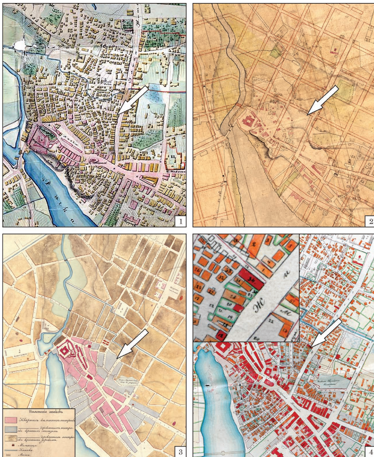
Рис. 2. Ділянка досліджень на мапах і планах XIX ст.: 1 — 1849 р.; 2 — 1860 р.; 3 — 1863 р.; 4 — 1866 р. Fig. 2. Area of research on maps and plans of the 19 th century: 1 — 1849; 2 — 1860; 3 — 1863; 4 — 1866