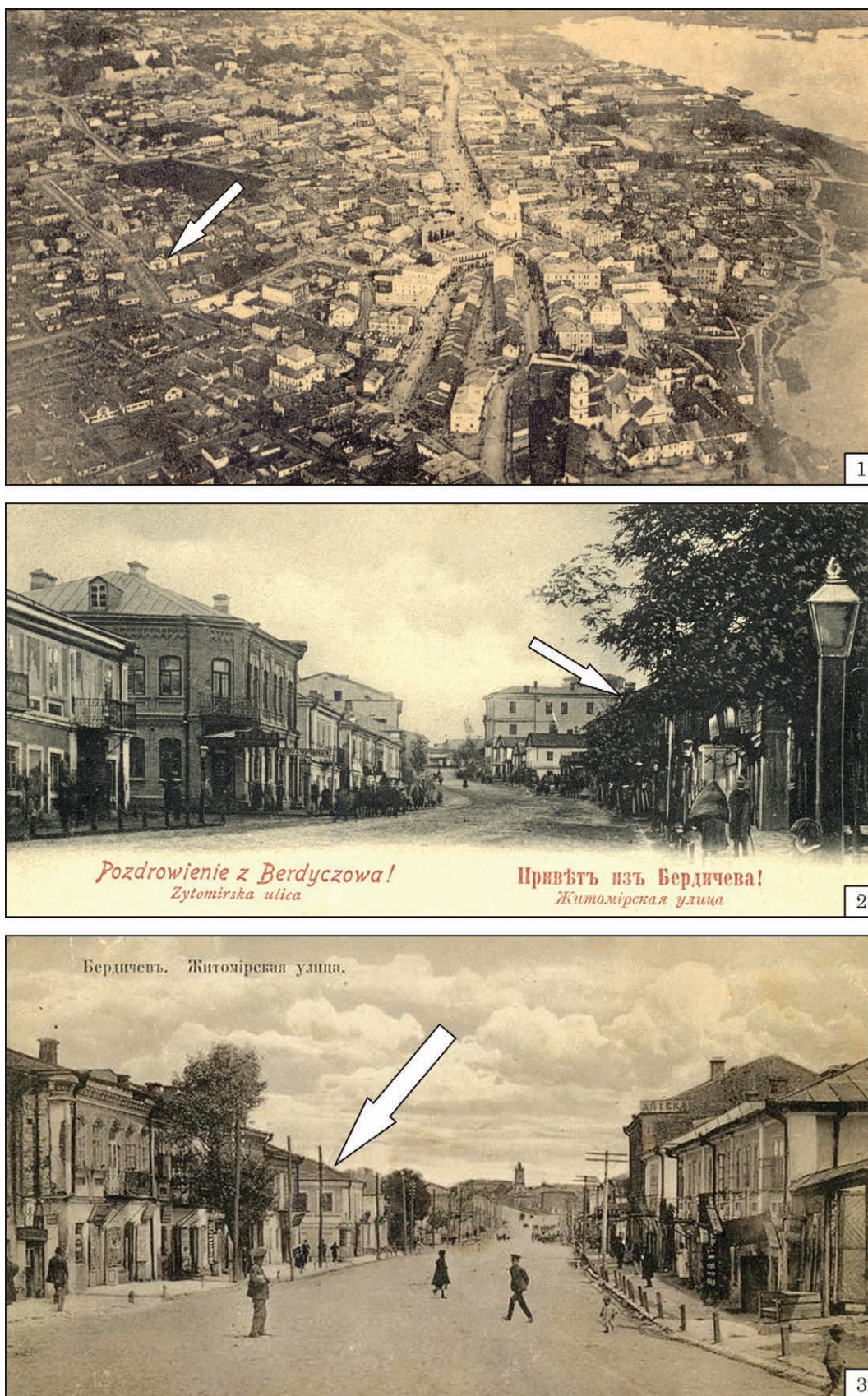
Рис. 3. Ділянка досліджень на поштових листівках: 1 — аерофото 1915 р. (вигляд із півночі); 2, 3 — панорама вулиці Житомирської 1917 р. (стрілка вказує на ділянку досліджень, навпроти — аптека Чудновського) Fig. 3. Research area on postcards: 1 — aerial photo of 1915 (view from the north); 2, 3 — a panorama of Zhytomirskaya Street in 1917 (the arrow points to the research area, opposite is Chudnovsky's pharmacy)