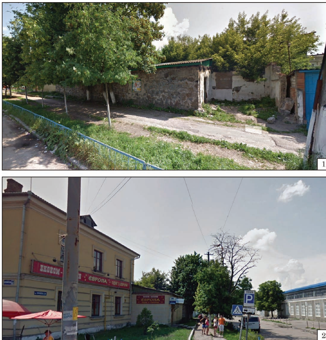
Рис. 4. Ділянка досліджень у 2015 р., вигляд із боку вулиці Вячеслава Чорновола. Сервіс Google Street Fig. 4. Research site in 2015, view from the side of Vyacheslava Chornovola Street. Google Street service

Саме тому «денна поверхня» в цьому випадку досить умовна й означена на рівні цоколя (верхньої межі фундаменту) новозбудованої споруди. Шурф доведено до глибини 1,6—1,7 м. Нижня межа дослідження зумовлена активним надходженням ґрунтових вод. Незважаючи на це в частині шурфу зроблений невеликий стратиграфічний зондаж до глибини 2,2 м. Стратиграфічні спостереження здійснено на основі поперечної та поздовжньої стінок. Загалом стратиграфічна ситуація така, як у шурфі 1. Проте, на цій частині ділянки верхній шар практично повністю відсутній, темно-коричневий шар прослідковано лише в поперечній, південно-західній стінці, на глибині 0,8—1 м. Під ним так само є шар завалу будівельного сміття, а ще нижче — темний перезволожений гумусований шар. У поперечній південно-західній стінці в її лівій частині виявлений заповнений піском перекоп (слід від траншеї під високовольтний кабель, який зараз виведений в повітряну лінію) та перекоп під закладання