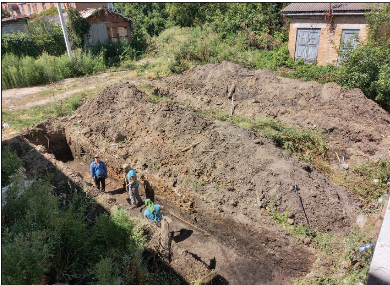
Рис. 5. Бердичів 2024. Місцерозташування траншей 1 та 2, фото із південного сходу