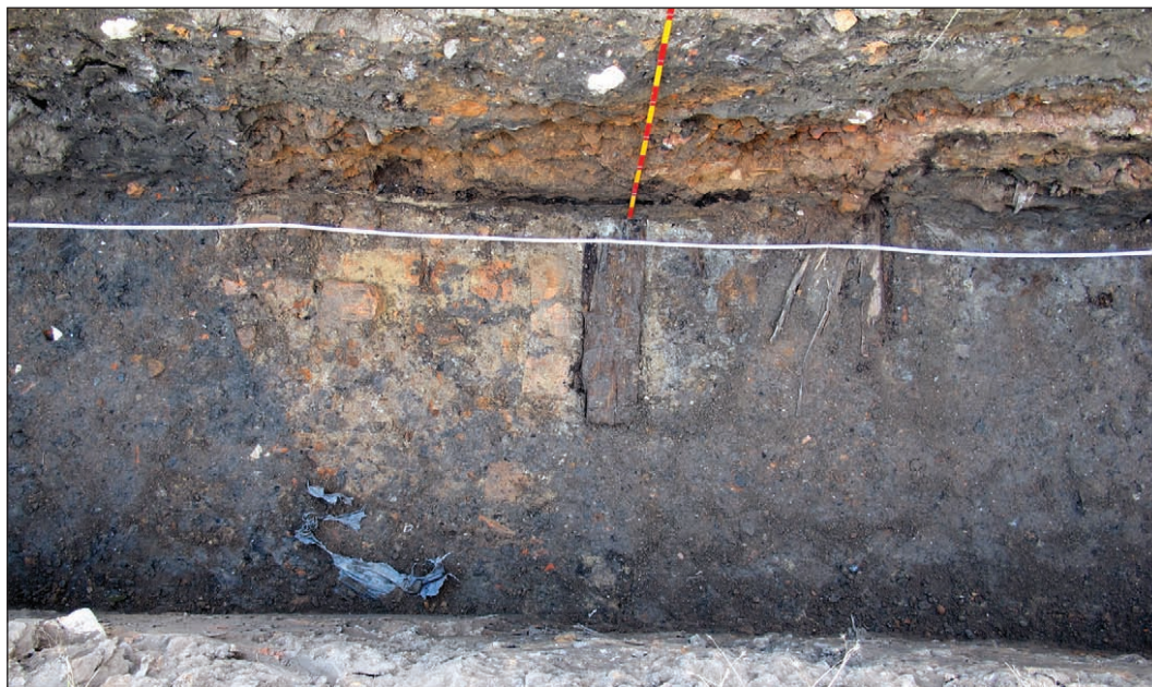
Рис. 7. Бердичів 2024. Планіграфія заглибленої частини об'єкту 1 в траншеї 1 Fig. 7. Berdychiv 2024. Planigraphy of the deepened part of object 1 in trench 1

бині 1—1,4 м. Вище нього розташовано перемішаний шар, складений із будівельного сміття, й насичений шматками цегли, уламками кераміки та скла XIX — початку XX ст. Зокрема тут знайдена керамічна люлька чорного кольору та кришечка від люльки. У лівій частині стратиграфічного зрізу зафіксований ямоподібний перекоп. Загалом стратиграфічна ситуація у траншеї практично аналогічна до стратиграфії в шурфах 1 та 2. У зрізі північно-західної стінки прослідкований переріз котловану споруди, не помітної на протилежній поздовжній стінці траншеї (рис. 6) і в стінках траншеї 2.