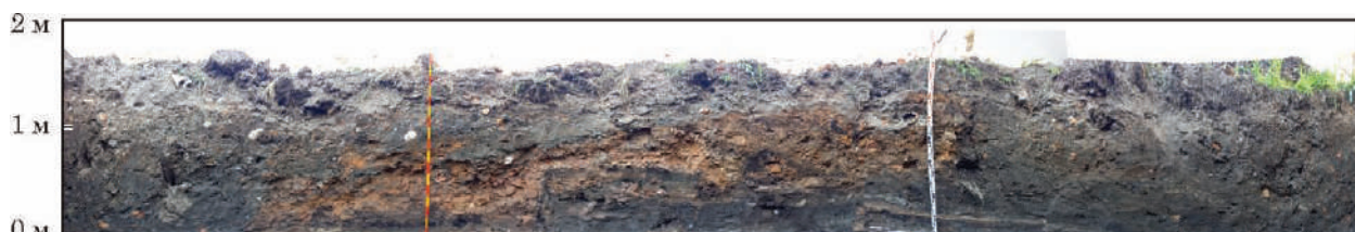
Рис. 6. Бердичів 2024. Стратиграфія північно-західної стінки траншеї 1