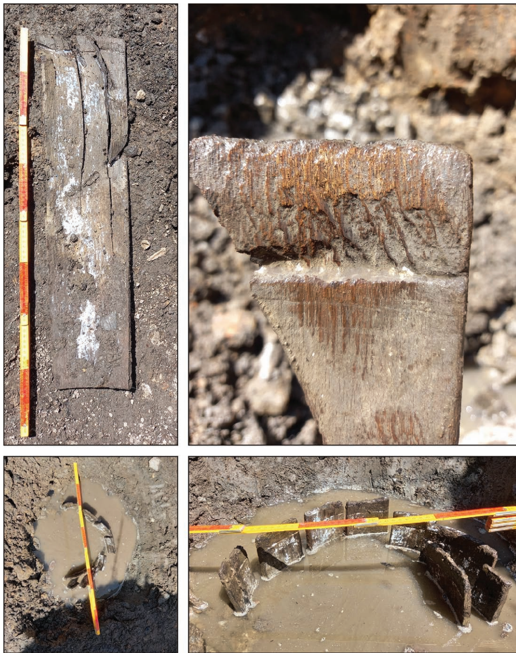
Рис. 9. Бердичів 2024. Дерев'яні бочка та бочкова клепка в траншеї 2