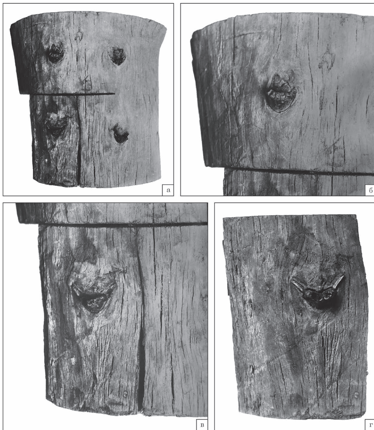
Рис. 1. Частини ритуального дуба 1909 р., р. Десна поблизу монастиря Миколи Пустинного (нині ур. Микільська Пустинка / Лужок) поблизу південної околиці с. Новосілки Вишгородського району Київської області: а—в — світлини 1910/1911 р.; г — світлина 1920-х / 1930-х рр. НА ІА НАН України