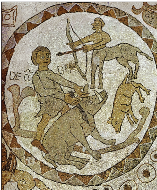
Рис. 11. Місяць грудень. Деталь підлогової мозаїки із зображенням календаря річного циклу сільсько-господарських робіт. 1163—1165 рр., центральний неф кафедрального собору м. Отранто, провінція Лечче, Італія.

Fig. 11. The month of December. Detail of a floor mosaic depicting a calendar of the annual cycle of agricultural work. 1163—1165, central nave of the Cathedral of Otranto, province of Lecce, Italy. Photo from: https://www.pinterest.com/pin/69946600452817953/