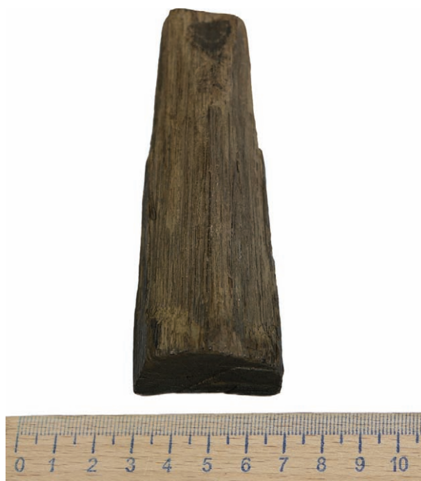
Рис. 8. Кілочок із заглиблення для щелепи в стовбурі дуба 1978/1979 р.

Fig. 7. The survived left half of the jaw of a domestic sow from the trunk of an oak tree of 1978/1979: a, b — view of the outer and inner sides