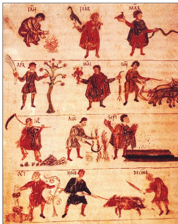
Рис. 10. Ілюмінований календар річного циклу сільськогосподарських робіт. 818 р., рукописний збірник «Liber Calculationis» (BSB Clm 210), район м. Зальцбурга, Австрія.