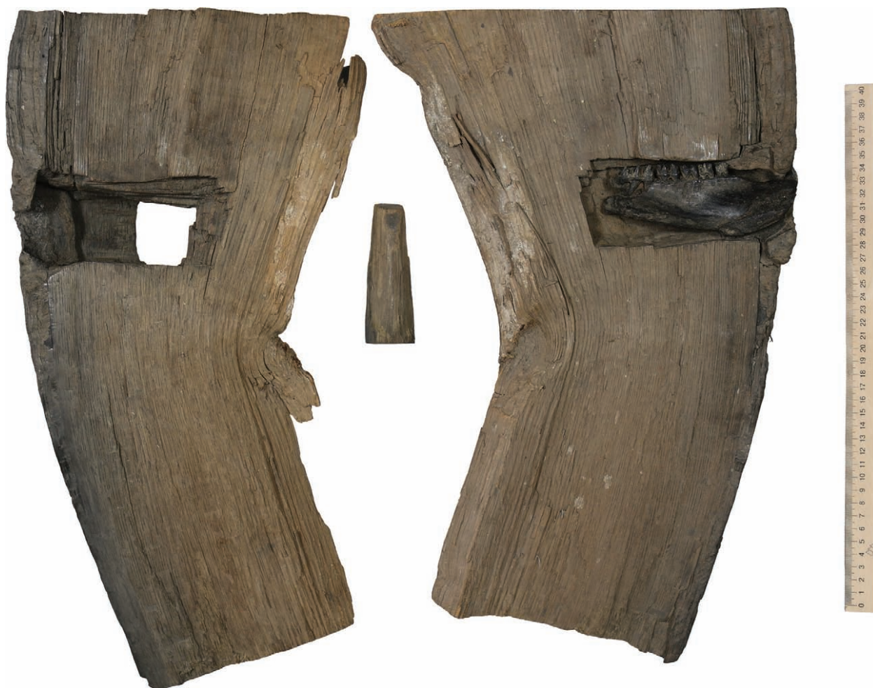
Рис. 5. Частина стовбура ритуального дуба 1978/1979 р. зі вставленою щелепою (загальний вигляд розвороту розітнутої деревини)