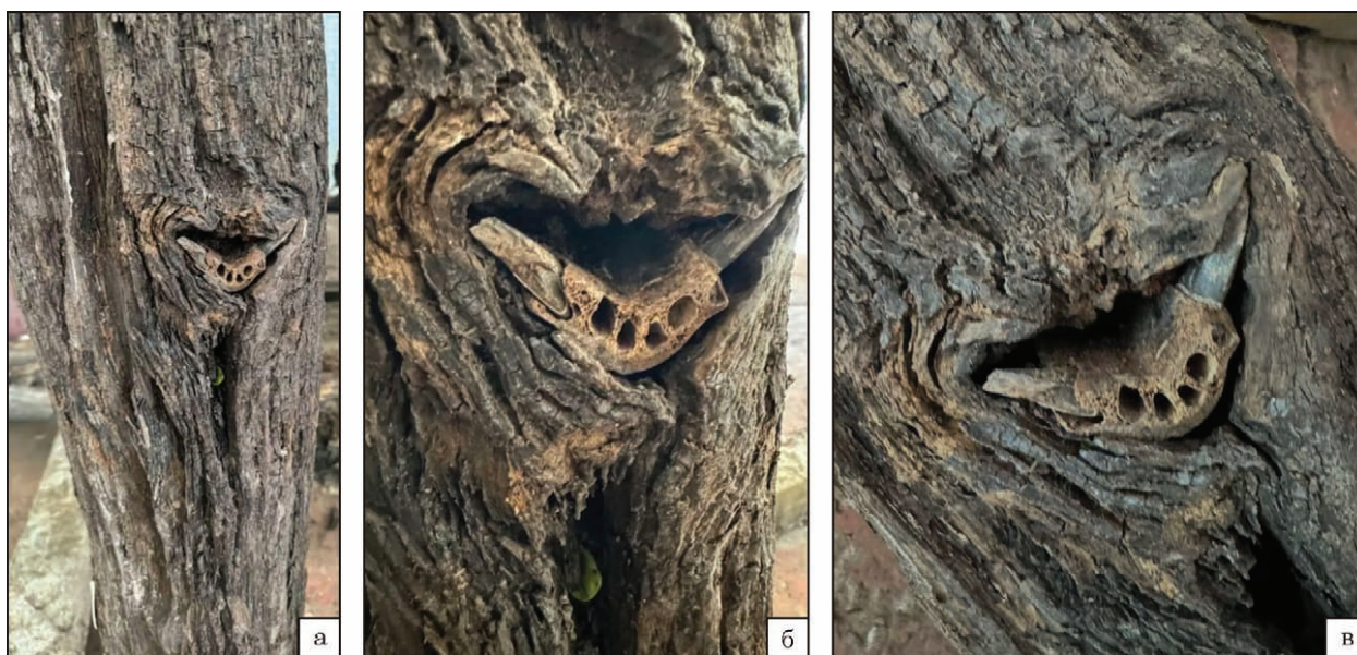
Рис. 9. Уціліла колода від ритуального дуба 2024 р. Середина 70-х — перша половина 90-х років X ст., «велике» городище на р. Менка Мінського району Мінської області, Республіка Білорусь: а—в — частина дубової колоди зі вставленою щелепою.