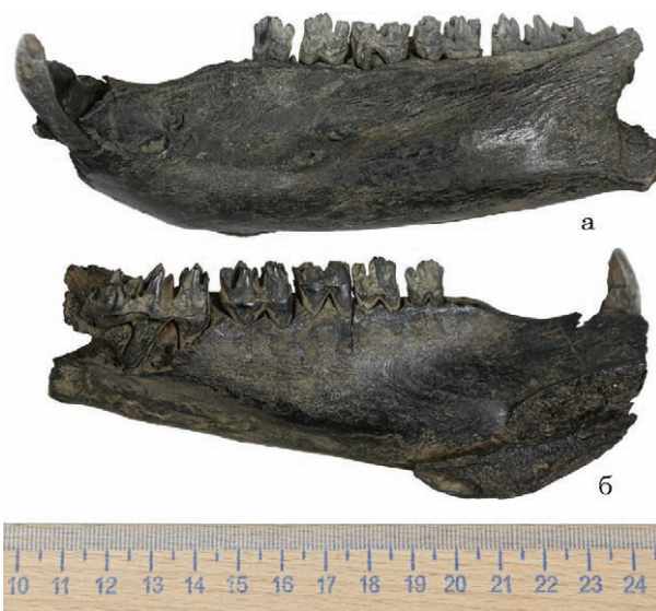
Рис. 7. Вціліла ліва половина щелепи свійської свині-матки зі стовбура дуба 1978/1979 р.: а, б — вигляд зовнішнього та внутрішнього боків

Fig. 7. The survived left half of the jaw of a domestic sow from the trunk of an oak tree of 1978/1979: a, b — view of the outer and inner sides