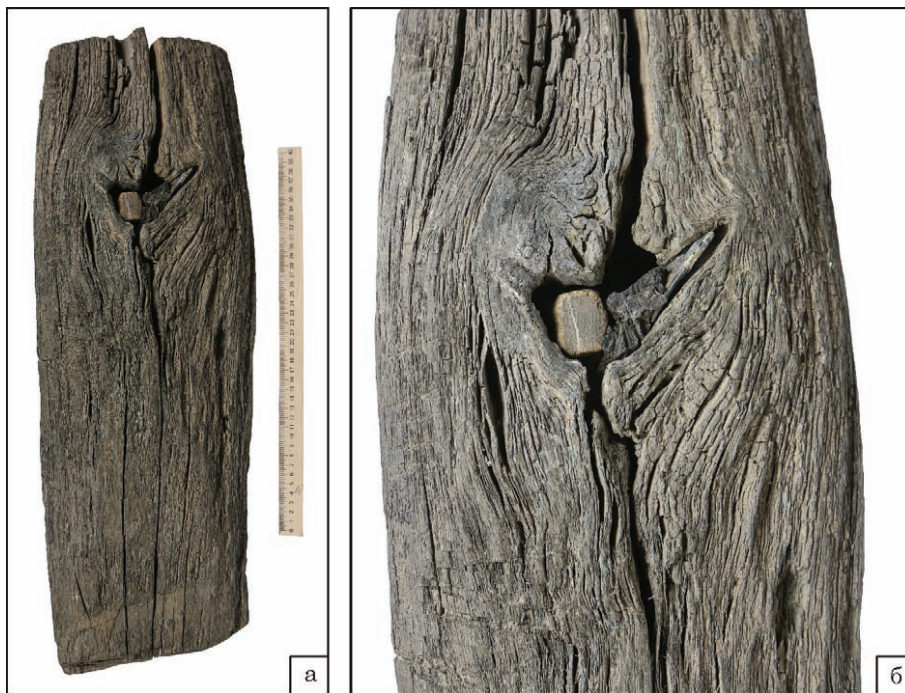
Рис. 4. Частина стовбура ритуального дуба 1978/1979 р. зі вставленою щелепою: а — загальний вигляд із чільного боку; б — вигляд місця вставлення щелепи. Національний музей-заповідник українського гончарства (сmt Опішне Полтавської області). Світлина Т. Пошивайла (також рис. 5—8), 2024 р.