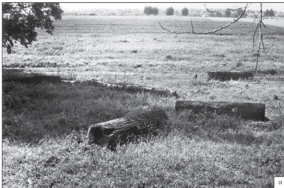
Fig. 3. Four survived logs from the trunk of the ritual oak of 1978/1979. Fourth quarter of the 8 th / mid-9 th — late 10 th / mid-11 th century, Desna river near the Kolichivka village, Chernihiv district, Chernihiv region: a — at the place of discovery, the outskirts of village; б — on the territory of the Museum of Folk Architecture and Life of Ukraine of the National Academy of Sciences of Ukraine (Kyiv, Pyrohiv village).

Рис. 3. Уцілілі чотири колоди від стовбура ритуального дуба 1978/1979 р. Четверта четверть VIII / середина IX — кінець X / середина XI ст., р. Десна поблизу с. Количівка Чернігівського району Чернігівської області: а — на місці виявлення колод, околиця села; б — на території Музею народної архітектури і побуту України НАН України (Київ, с. Пирогів).