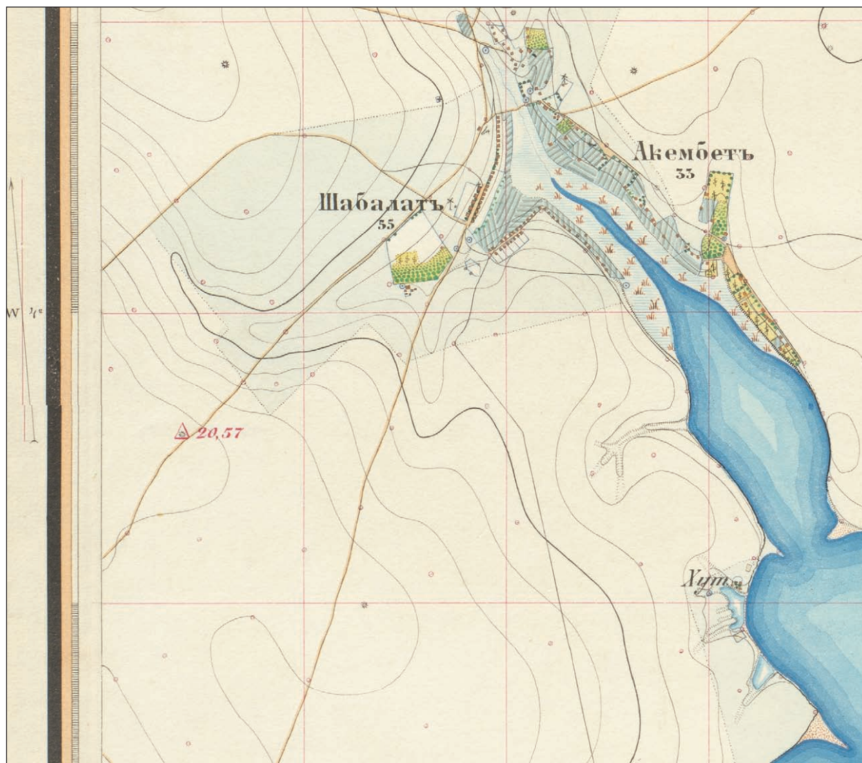
Рис. 10. Могила Мала Катаржа 1877 р. (Брульон «Військової зйомки Бессарабської губернії»; аркуш XXVII-36; М 1/2 версти в дюймі; фрагмент)