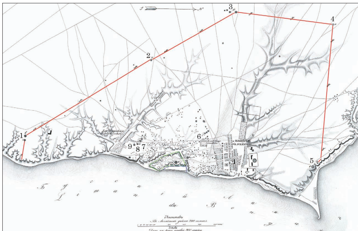
Рис. 3. Фрагмент «Плану міста Ольвії» (за: Уваров 1853, табл. VIII-A)