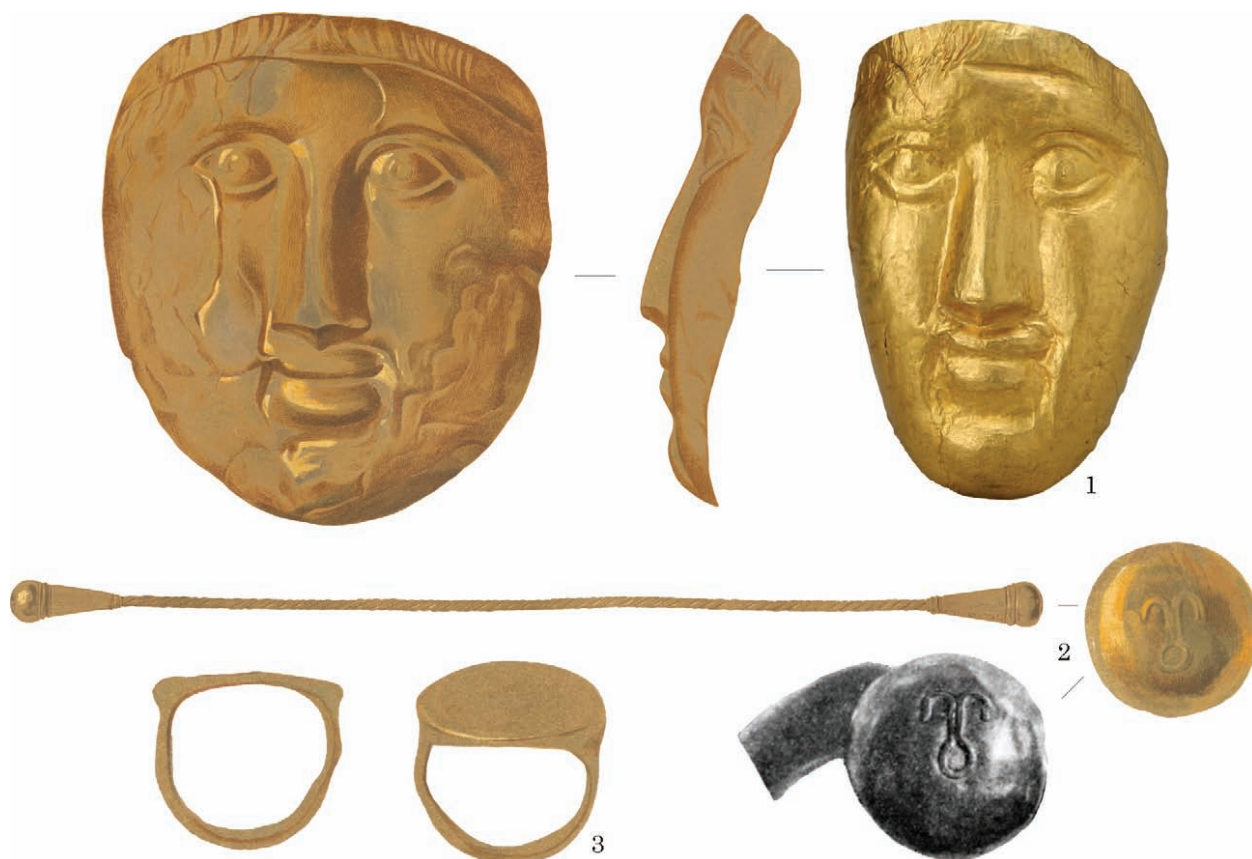
Рис. 5. Золоті вироби з кургану, розкопаного 1842 р. (Уваров 1853, табл. XIV; Соломоник 1959, с. 131)