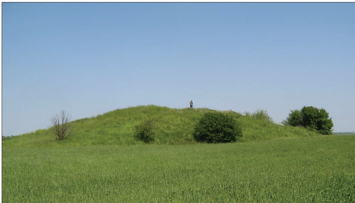
Рис. 11. Могила Мала Катаржа (Уварова). Вид з південного заходу