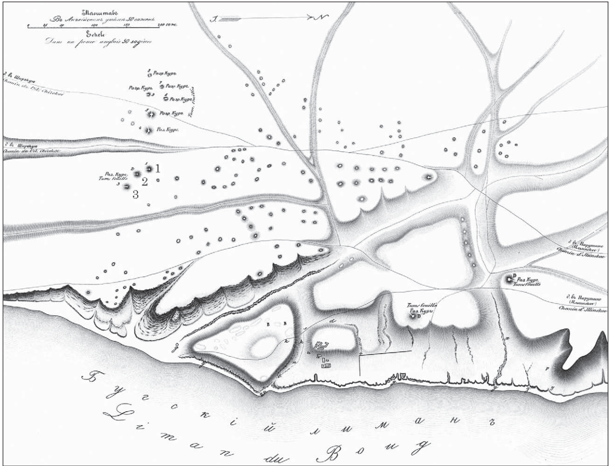
Рис. 7. План Ольвії на фрагменті «Плану акрополя і народної площі» (Уваров 1853, табл. VIII-B) Fig. 7. Plan of Olbia on the fragment «Plan of the acropolis and people's square» (after Uvarov 1853, tab. VIII-B)

звернули увагу А. А. Формозов (Формозов 1993, с. 231) та І. В. Тункіна (Тункіна 2002, с. 449).