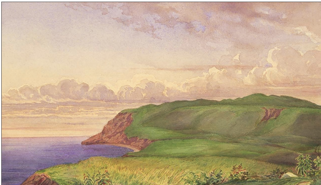
Рис. 1. Південна частина народної площі в Ольвії (Вебель М. Б., 1848)