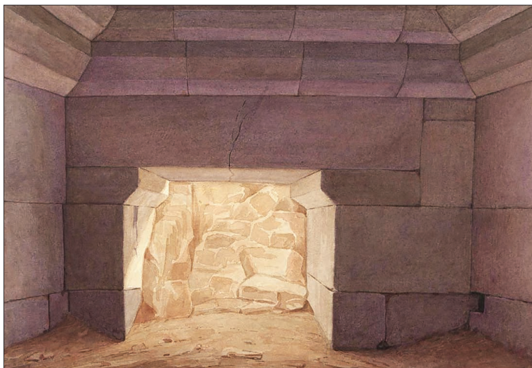
Рис. 6. Вид внутрішньої частини грецької гробниці (Вебель М. Б., склеп кургану 1/1844)