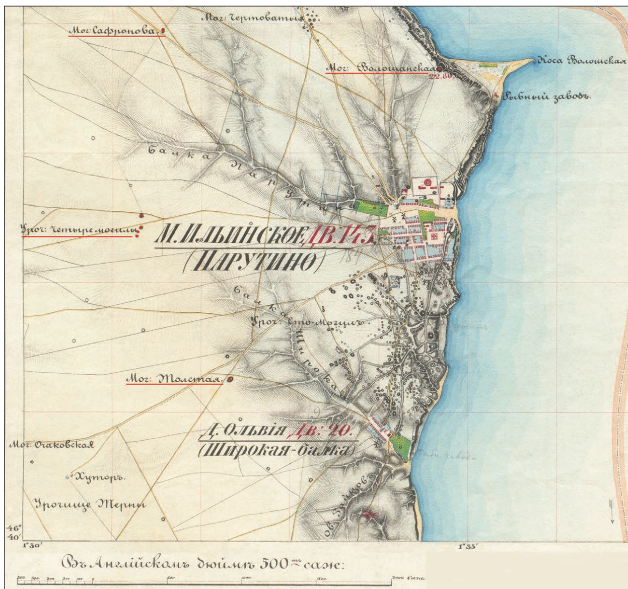
Рис. 4. Район Ольвії на фрагменті карти «Військової зйомки Херсонської губернії, зробленої з 1850 по 1853 роки» (аркуш XVI-11. Знімав і креслив топограф 2-го класу, унтер-офіцер Коморніков з 25 вересня по 14 жовтня 1851 року)

Fig. 4. The Olbia area on a fragment of the map «Military survey of Kherson province, made from 1850 to 1853» (sheet XVI-11. «Surveyed and drawn by 2 nd class topographer, non-commissioned officer Komornikov from September 25 to October 14, 1851»)