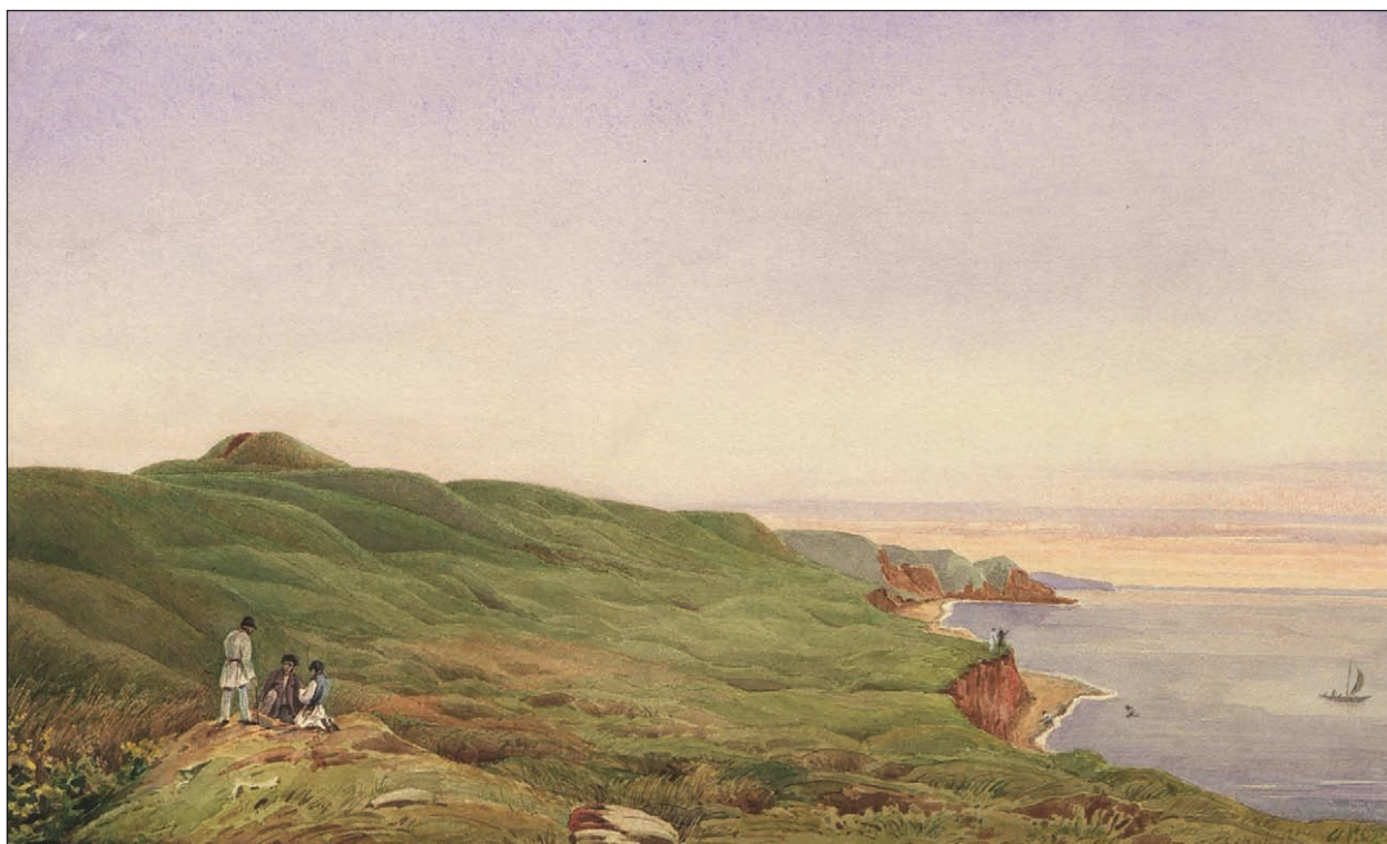
Рис. 2. Північна частина народної площі в Ольвії (Вебель М. Б., 1848). На задньому плані — «Зевсів» курган, перерізаний траншеєю