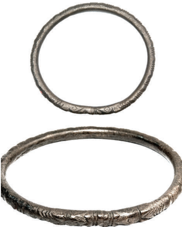
Рис. 3. Бронзовий ножний браслет, прикрашений рубчиками і зображеннями голів тварин на кінцях

Fig. 3. Bronze ankle bracelet decorated with welts and animal head-shaped finials