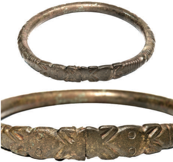
Рис. 2. Бронзовий ножний браслет із зооморфним оформленням закінчень