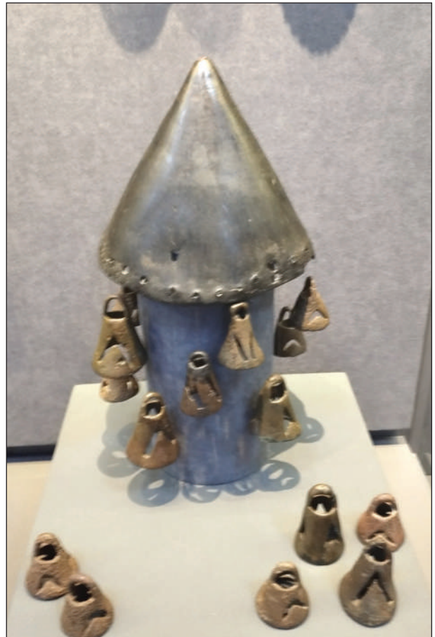
Рис. 11. Варіант реконструкції атрибута для поховальної церемонії

Як зазначив український дослідник В. Ятченко, хоча про шаманів читаємо у античних авторів, але послідовно і на новому рівні вивчення феномену почалося тільки в XX ст. (Ятченко