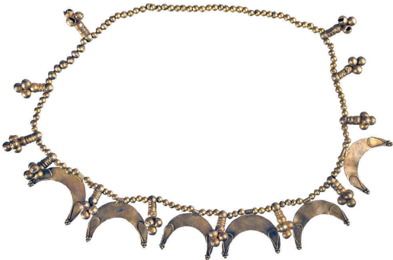
Рис. 5. Нашийна прикраса з костюма жінки, похованої на західній ділянці могили Fig. 5. Neck adornment of the female buried in the western part of the grave

вказані їх розміри і точне місце розміщення, то можна тільки зазначити, що за змістом трикутники (виноградні грона) входять до кола символів життєдайних богів. Схожі пластинки знайдено в кургані поблизу с. Будки (Ильинская 1968, табл. XXXIII: 23—26).