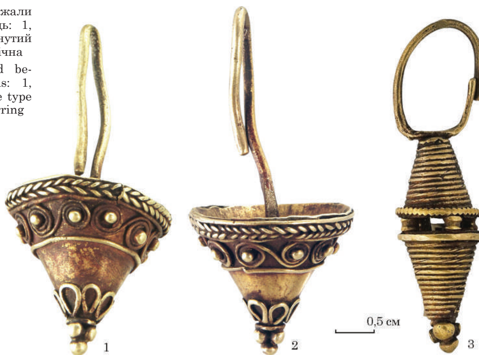
Fig. 7. Earrings, located between deadwomen heads: 1, 2 — the upside-down cone type earrings; 3 — biconical earring

та ін. 2021, кат. № 11, інв. № ДМ-6352; рис. 7: 1—3). Сережка нагадує геометричну фігуру, утворену двома конусами, з'єднаними основами, між якими напаяні чотири кульки зерні. Кожний конус виготовлено зі спіралью намотаних дротинок. До верхньої деталі припаяна дужка із круглого у перетині дроту, кінці якої заходять один за одного. Завершення нижнього конуса сережки — пірамідка з чотирьох кульок зерні (висота — 43 мм; ширина 11 мм; D дужки 16 × 11 мм; H підвіски 27 мм). На землях Скіфії, як підкреслила В. А. Іллінська, оздоба такої форми надзвичайно рідкісна, а областю поширення біконічних сережок є територія Інгушетії (Луговий могильник), тобто, можливо, подібні прикраси свідчать про певні зв'язки з Кавказом (Ильинская 1968, с. 140).