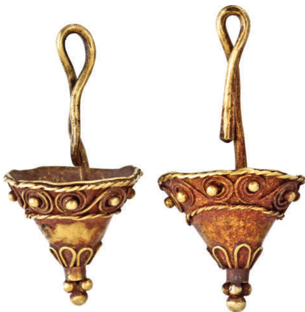
Рис. 1. Серезки типу «перекинутий конус» з костюмного комплексу небіжчиці на східній ділянці склепу Fig. 1. The «upside-down cone» type earrings from the costume complex of the female buried in the eastern part of the crypt

стави припустити, що в деяких могилах (всього у чотирьох) було двоє небіжчиків (Ильинская 1968, с. 43—53). Але це складає більше 20 % у некрополі. На жаль, зараз не всі матеріали, одержані під час досліджень, «дійшли» до нас. Йдеться про описи поховань, схеми розміщення артефактів, а також деякі з них.