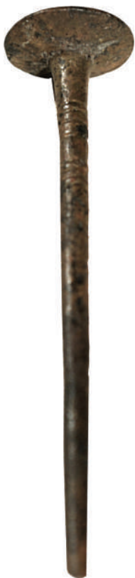
Рис. 6. Фрагмент шпильки з поховання на західній ділянці склепу

Шпильки були характерною ознакою вбрання жінок, які жили на території Лісосте-