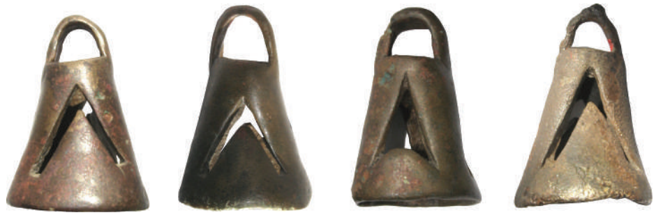
Fig. 10. Bronze bells in the shape of cut cones with rounded topsides

с. 174). Ці думки про застосування наверх вже не раз висловлювали дослідники і обґрунтовували створення особливого музичного «супроводу» під час поховальних обрядів (Фрунт 2023, с. 81—93).