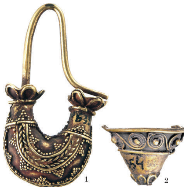
Рис. 4. Сережки з костюмного комплексу жінки на західній ділянці могили: 1 — сережка типу кораблик; 2 — сережка типу «перекинутий конус» (фрагмент)

Fig. 4. The earrings from the costume complex of the female from the western part of the crypt: 1 — boat type earring; 2 — «Upside-down cone» type earring (fragment)