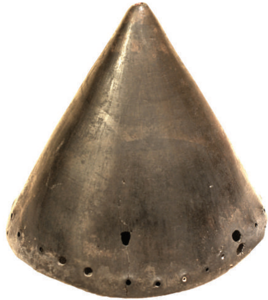
Рис. 9. Навершя у формі порожнистого конуса із бронзи

На цій же (східній) ділянці зафіксовано порожнистий бронзовий конус (висота 115 мм, діаметр 230 мм; рис. 9). Предмет відлитий з бронзи, поверхня добре заглажена, знизу по колу пробиті маленькі отвори. Крізь них до конуса, мабуть, були прикріплені бронзові литі ажурні дзвоники: 26 екз. (висота 60—63 мм; діаметр 36—44 мм) у вигляді зрізаних конусів із заокругленою верхівкою. На боках виробів — фігурні вирізи у формі трикутників, а також стрілоподібні (дві вузькі смужки, з'єднані під кутом вершиною вгору), завершення — велика петля (рис. 10). Такі ж дзвоники були прикрасами спорядження коней. За класифікацією О. Могилова, предмети належать до типу «зрізанокопичні дзвіночки (іноді з опуклими чи увігнутими боками та петлею)» (Могилов 2008, с. 86).