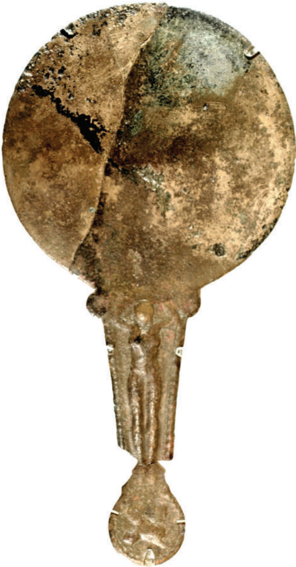
Рис. 8. Дзеркало із зображенням жіночого божества на ручці