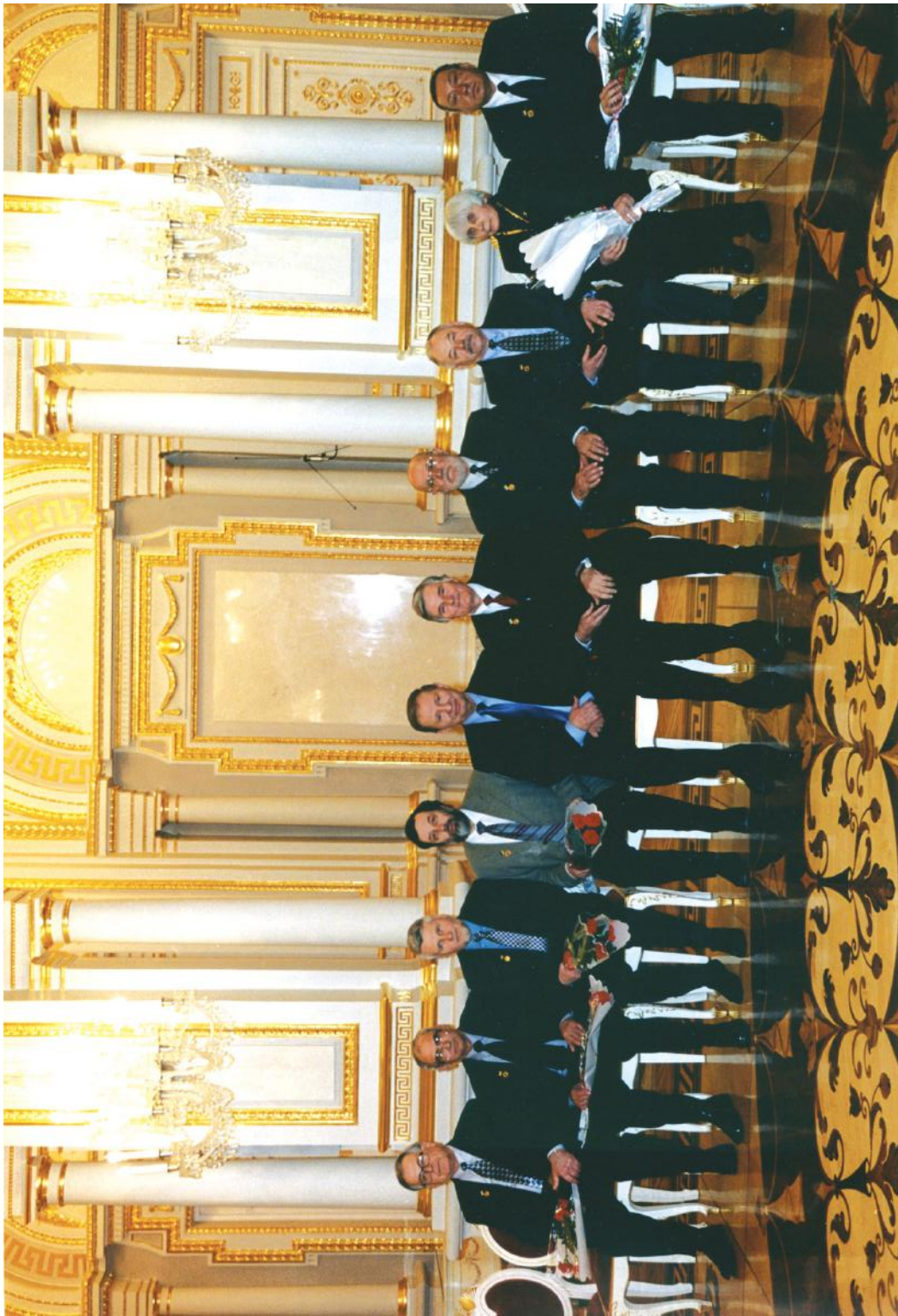
Вручення державної премії 2003 р.