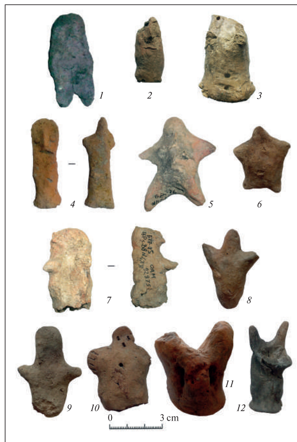
Рис. 4. II група. Статуетки без ознак статі: 1 — Надлиманське городище; 2—4 — Ніконії; 5—12 — Тіра

18. Зображення людини. Має овальне тіло, руки виконано у вигляді виступів; сплюснена, маленька голова (рис. 4, 10). Очі та рот виконано проколами. На тілі отвором показаний пуп. На кінцях рук насічками показано пальці. Глина темно-коричнева з домішками шамоту та