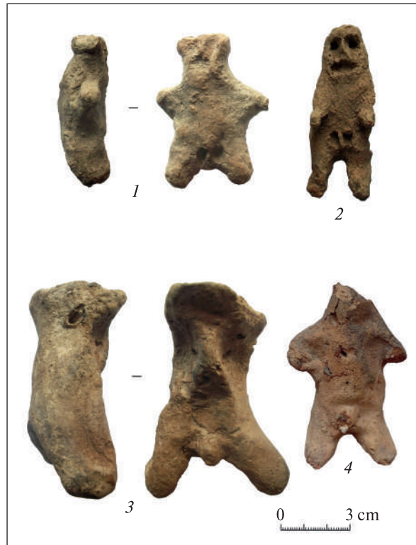
Рис. 3. II група. Чоловічі статуєтки. 1–3 — Ніконій; 4 — Тіра

8. Зображення чоловіка. Виліплені руки та ноги, виступом показано статеві органи (рис. 3, 4). Права рука зігнута в лікті та покладена на поперек. На грудях горизонтальний отвір (глибина 1,0 см). Біля голови невелике заглиблення. Схожі заглиблення на тильній стороні (імовірно, у результаті вигорання рослинних домішок). Там само прокресленою лінією показані сідниці. Голова та частина лівої руки відбиті. Глина груба світло-коричнева з домішками піску. Обпалення нерівномірне.