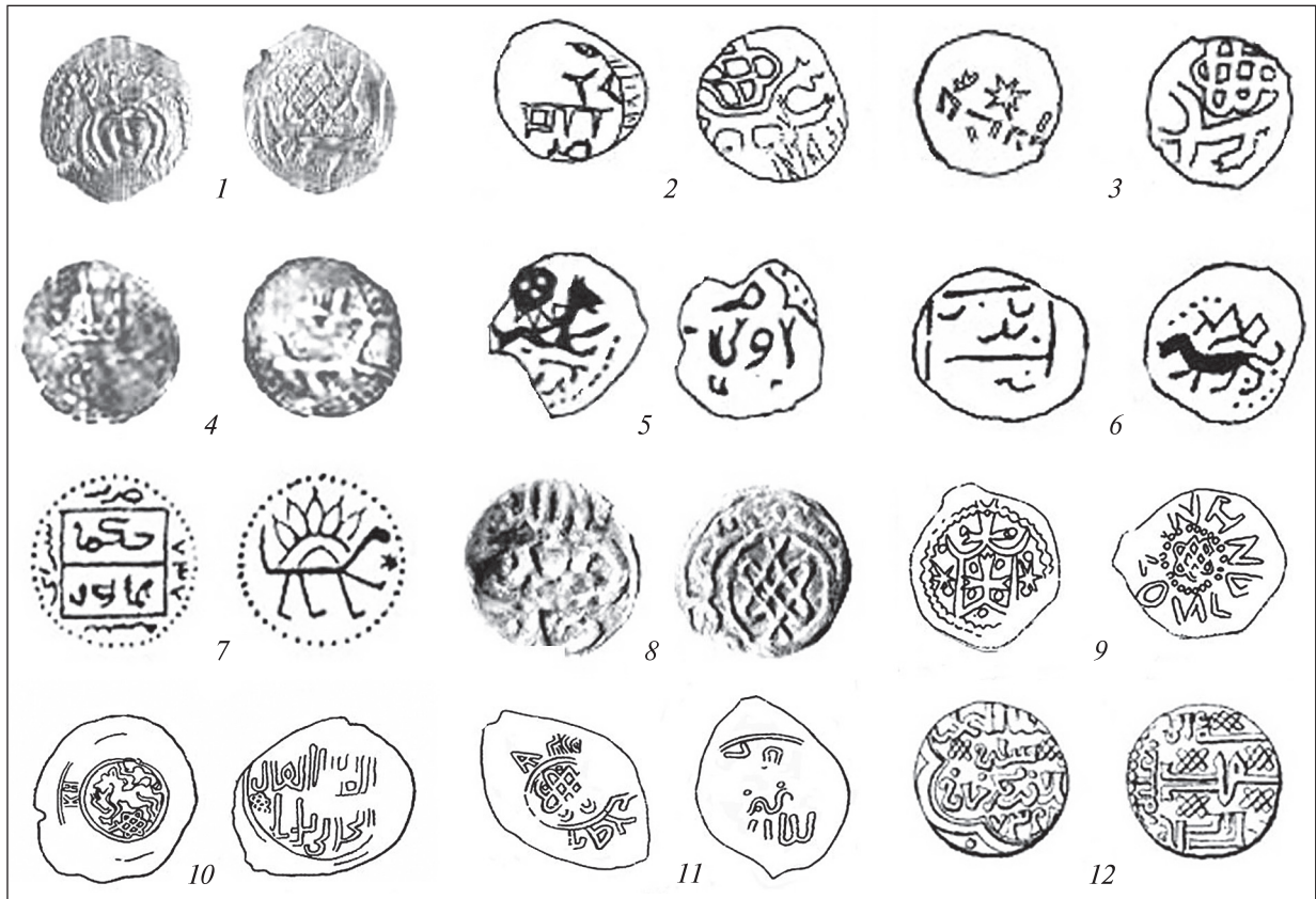
Рис. 1. Литовські, золотоординські, руські та київська монети з «плетінками»: 1 — литовська монета типу «Наркунай» (за: Волкайте-Куликаускене, Лухтан 1981, рис. 2); 2, 3 — литовські монети XIV ст. з чотирилапою твариною під «плетінкою» і легендою (за: Грималаускайте 2001, с. 121, № 3, 8); 4 — монета з Василицького скарбу № 1319/21 (за: Зразюк, Строкова, Хромов 2007); 5–7 — золотоординські монети і наслідування з Саратовського краєзнавчого музею (за: Пырсов 2002, № 20, 83, 84); 8 — срібна монета Абдуллаха (1363–1370) з «плетінкою» в лінійному обідку (за: Гончаров 2015, с. 3, рис. 3, № 3); 9 — київська монета Володимира Ольгердовича з «плетінкою» (1362–1394); 10, 11 — монети Північно-Східної Русі з «плетінкою» в лінійному обідку та з чотирилапою твариною над «плетінкою» (за: Федоров-Давыдов 1989, № 431, 403); 12 — дирхем Узбека (1313–1341) з сімома «плетінками» (за: Григорьев 1850, с. 6, таб. 1, рис. 2).

Fig. 1. Lithuanian, the Golden Horde, Rus and Kyivan coins with «plaitings»: 1 — Lithuanian coin of the «Narkūnai» type (after: Volkayte-Kulikauskene, Luhtan 1981, fig. 2); 2, 3 — Lithuanian coins of the 14 th century with four paws animal under «plaiting» and the legend (after: Grimalauskayte 2001, p. 121, 3, 8); 4 — coin from the Vasylytsia treasure, No. 1319/21 (after: Zraziuk, Strokova, Khromov 2007); 5–7 — the Golden Horde coins and imitations from the Saratov Local History Museum (after: Pysrov 2002, Nos. 20, 83, 84); 8 — silver coin of Abdallah Khan (1363–1370) with «plaiting» in round framing (after: Honcharov 2015, p. 3, fig. 3, 3); 9 — Kyivan coin with «plaiting» of Volodymyr Olherdovych (1362–1394); 10, 11 — coins of North-Eastern Rus with «plaiting» in round framing and with four paws animal above «plaiting» (after: Fedorov-Davydov 1989, Nos. 431, 403); 12 — dirham of Öz Beg Khan (1313–1341) with seven «plaitings» (after: Grigoriev 1850, p. 6, tab. 1, fig. 2)