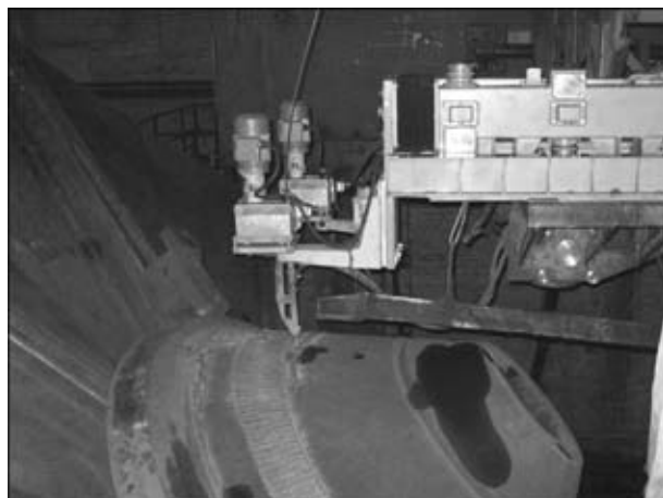
Рис. 2. Внешний вид аппарата А-1812М