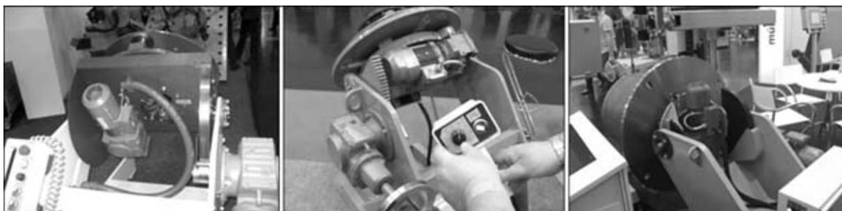
Рис. 1. Универсальные позиционеры, в приводе вращения которых используется асинхронный электродвигатель

ИЗМСО работает над внедрением электроприводов нового поколения — вентильного типа. В начале 2009 г. был создан ряд экспериментальных позиционеров на базе отечественных вентильных