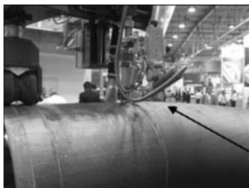
Рис. 8. Рабочий орган следящей системы, смонтированный на сварочной головке

ют эту проблему по-разному. Так, фирма «Lambert Jouty» устанавливает следящую систему по смещению изделия и в зависимости от этого значения система в автоматическом режиме дает сигнал на привод доворота осей ролика.