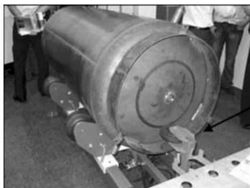
Рис. 7. Упорный ролик