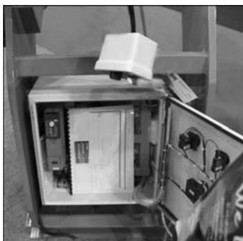
Рис. 3. Блок управления вентильного электродвигателя

электроприводов. Сегодня ИЗМСО готов к промышленному выпуску позиционеров с электроприводами нового поколения (рис. 5), которые позволят программировать некоторые элементы вращения изделия как по скорости вращения, так и по углу поворота изделия. Кроме того, при всех одинаковых характеристиках габаритные размеры и масса вентильных электроприводов меньше, чем у электроприводов с асинхронным электродвигателем. Сравнительные технические характеристики этих вращателей с регулируемыми электроприводами на основе асинхронных и вентильных электродвигателей представлены в таблице.