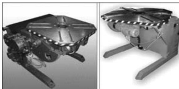
Рис. 4. Универсальные позиционеры производства ИЗМСО

Существует большое разнообразие роликовых вращателей (рис. 6), требования к которым относительно скорости вращения, точности уста-