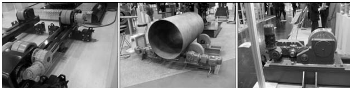
Рис. 6. Роликовые вращатели с различными компоновочными схемами приводов

новки роликов относительно оси изделия, быстроты переустановки роликов на требуемый диаметр изделия остаются те же. При неточном расположении оси роликов относительно оси вращения изделия наблюдается такое явление, как смещение свариваемого изделия вдоль его оси (дрейф), что, в свою очередь, приводит к уходу сварного шва с места сварки. Смещение зависит от диаметра изделия и угла непараллельности осей изделия и роликов. Различные фирмы реша-