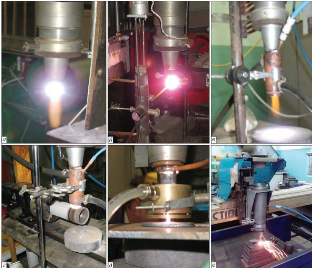
Рис. 1. Лабораторные стенды для изучения технологических возможностей НОР: а — НОР, горящий в струе аргона, в атмосфере; б — гибридное взаимодействие НОР и микроплазмы; в — плазматрон, действующий на основе НОР в среде азота; г — обработка тел вращения при помощи НОР; д — гибридный плазматрон с накачкой НОР дугой постоянного тока; е — наплавка при помощи НОР

Интересные результаты получены при скрещивании НОР с потоком аргоновой плазмы, генерируемой дуговым плазматроном (рис. 1, б ). В этом устройстве газообразные и порошковые прекурсо-