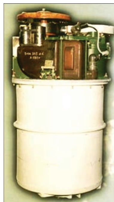
Автоматизированная сварочная установка «Вулкан»

В создании установки принимали участие ведущие ученые института, конструкторы, технологи, рабочие-сборщики аппаратуры, испытатели. Большую помощь в создании установки оказали специалисты РКК «Энергия» им. С.П. Королева. Она позволила выполнять сварку плавлением тремя различными способами: дугой низкого давления с плавящимся электродом, сжатой дугой низкого давления с полым катодом и электронным лучом. Установка «Вулкан» состояла из двух отсеков. В одном (не герметичном) располагались устройства для выполнения каждого из перечисленных способов сварки и вращающийся стол со свариваемыми образцами. Во время работы в этом отсеке поддерживалось низкое давление — космический вакуум. В другом отсеке (герметичном) были установлены автономный аккумуляторный источник электропитания, вторичный источник питания (ВИП — разработка Института электродинамики НАН Украины), блоки управления, средства измерения. Установка была оснащена дистанционным пультом управления. Масса аппаратуры около 50 кг.