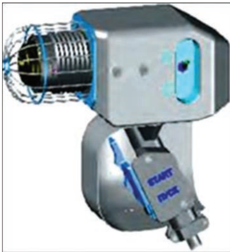
Ручной электронно-лучевой инструмент нового поколения

возможность существенно уменьшить габариты и массу инструмента, повысить его маневренность при осуществлении технологических процессов в открытом космосе, увеличить срок непрерывной работы и эксплуатационную надежность, а также облегчить операции замены инструментов разного технологического назначения непосредственно за бортом космического аппарата.