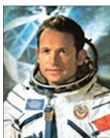
Георгий Степанович Шонин (1935–1997 гг.) — летчик-космонавт СССР, Герой Советского Союза

Создатель практической космонавтики Сергей Павлович Королев еще в начале 1960-х гг. поставил перед Институтом электросварки им. Е.О. Патона задачу — разработать программу экспериментов для осуществления сварки и резки в космосе. Эта программа научных исследований, конечной целью которой было создание сварочной аппаратуры и технологий для соединения материалов в космосе с помощью сварки, начала осуществляться в 1964 г., а в октябре 1969 г. были проведены эксперименты.