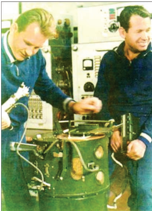
Кубасов В.Н. и Шонин Г.С. с установкой «Вулкан» перед полетом на корабле «Союз-6» (1969 г.)

Мощность сварочных устройств для различных способов составляла от 0,6 до 1,0 кВт.