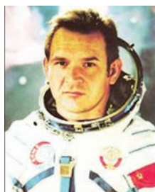
Валерий Николаевич Кубасов (1935–2014 гг.) — летчик-космонавт СССР, дважды Герой Советского Союза

В 1957 г. окончил Ейское военно-морское авиационное училище летчиков. Служил в ВВС Военно-Морского Флота СССР. В 1960 г. он отобран в отряд космонавтов. В 1968 г. окончил Военно-воздушную инженерную академию имени Н.Е. Жуковского. Кандидат технических наук. Совершил космический полет 11–16 октября 1969 г. в качестве командира космического корабля «Союз-6». С ноября 1990 г. Г.С. Шонин находился в запасе.