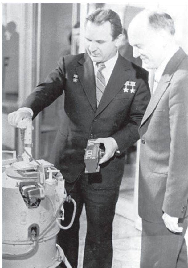
Патон Б.Е. и Кубасов В.Н. возле установки «Вулкан»