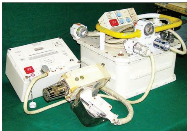
Комплект оборудования для ручной электронно-лучевой сварки «Универсал»

В настоящее время в ИЭС им. Е.О. Патона проводятся работы по созданию следующего поколения электронно-лучевого инструмента для сварки в открытом космосе, который включает триодную электронно-лучевую пушку, отделенную от высоковольтного источника питания. Отделение электронно-лучевой пушки от источника питания и использование для этой цели гибкого высоковольтного кабеля с малогабаритным высоковольтным разъемом дает