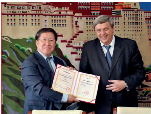
Підписання офіційних документів про створення та організацію діяльності Китайсько-українського інституту зварювання ім. Є.О. Патона (2012–2013 рр.). Зліва – направо: губернатор провінції Гуандун пан Чжу Сяодань, президент Національної академії наук України, почесний голова Ради КУІЗ академік Б.Є. Патон, заступник міністра науки і техніки КНР, почесний голова Ради КУІЗ пан Цао Цзяньлін, заступник директора ІЕЗ, голова Ради КУІЗ академік І.В. Кривцун