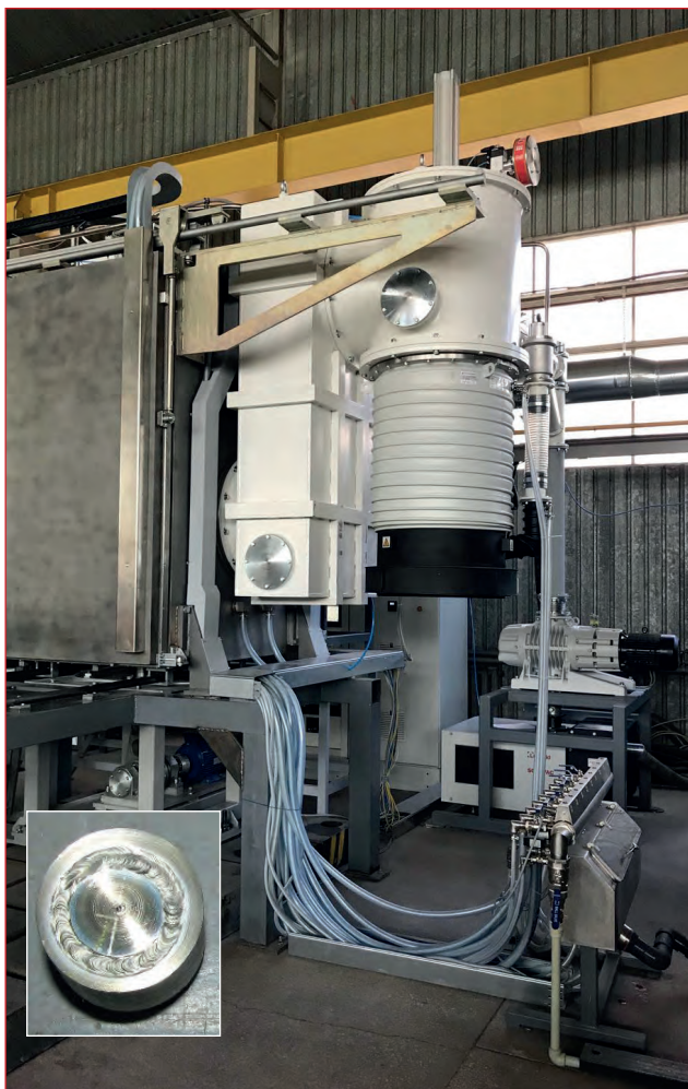
Установка електронно-променевого зварювання для застосування в гранульній металургії

◆ розробка технології та обладнання для отримання порошків сферичної форми з високоміцних складнолегованих титанових сплавів із застосуванням плазмових процесів;