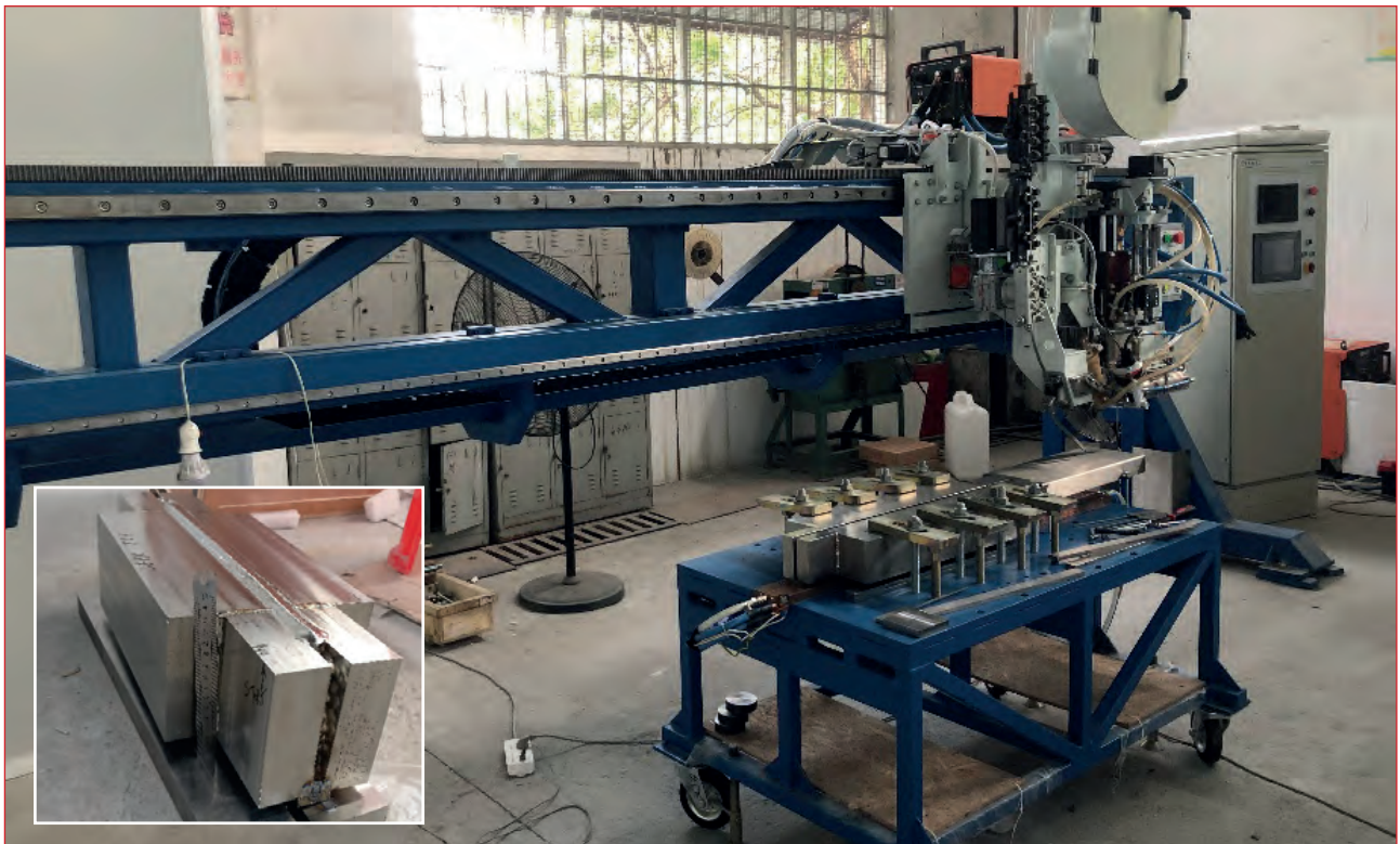
Устаткування для зварювання у вузький зазор в керованому магнітному полі довгомірних конструкцій з титанових сплавів товщиною 20...120 мм і довжиною до 4 м та зварний виріб з титанового сплаву Ti4-Al-2V товщиною 120 мм

тичного устаткування по шару активного флюсу (А-ТІГ);