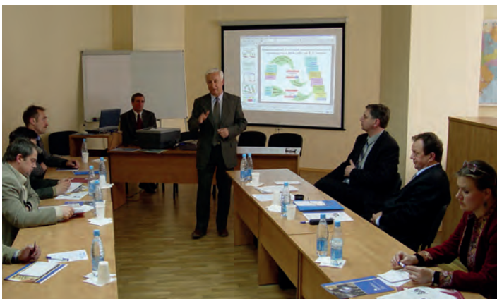
Заняття в групі інженерів зі зварювання

Сучасне зварювальне виробництво пред'являє спеціальні вимоги до професійної підготовки