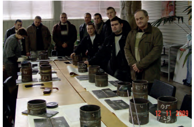
Підтвердження професійної кваліфікації