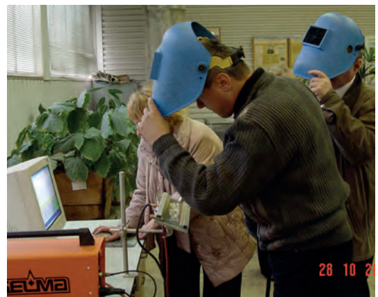
Заняття в комп'ютерно-тренажерному класі