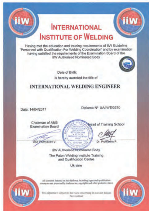
Диплом міжнародного інженера зі зварювання

Центр є учасником міжнародних програм з підготовки персоналу зварювального виробництва й використовує в навчальному процесі інноваційні