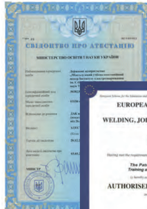
Сертифікати та свідоцтво про акредитацію

умінь, пов'язаних з реалізацією функцій управління, координації та забезпечення якості зварювання відповідно до вимог національних, європейських і міжнародних стандартів.