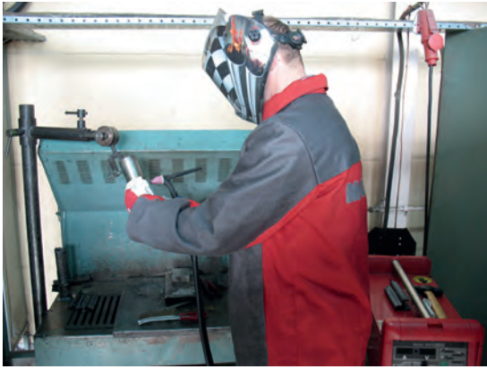
Практичне заняття у навчальній майстерні