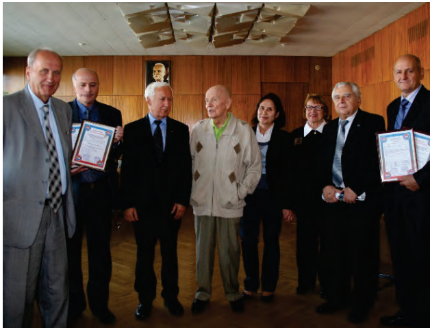
ПАТ «Краматорський завод важкого верстатобудування» та АТ «ТУРБОАТОМ»