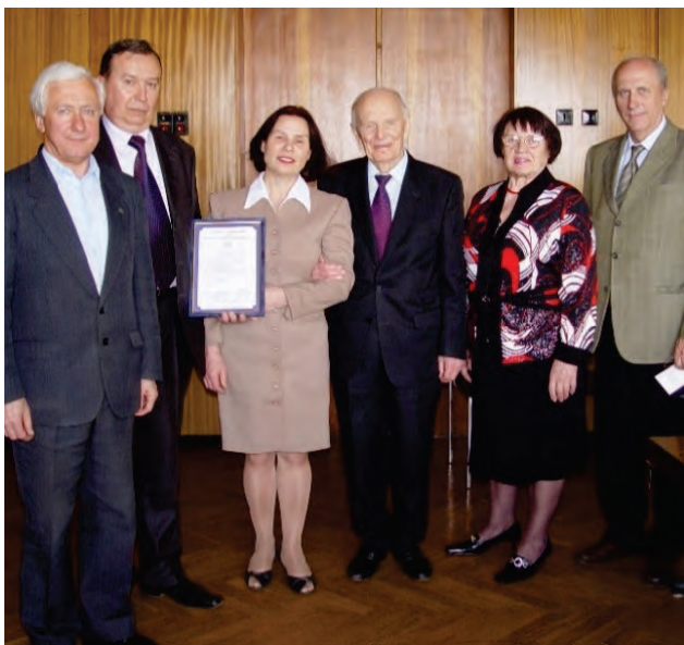
ПАТ «Запорізький завод важкого кранобудування»