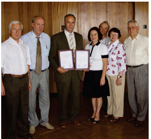
ПАТ «Крюківський вагонобудівний завод»