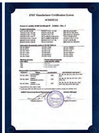
Міжнародний та Європейський сертифікати підприємств