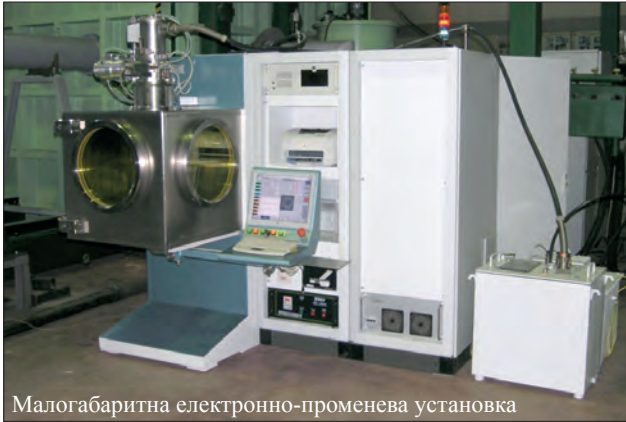
Малогобаритна електронно-променева установка

мально підвищити коефіцієнт використання внутрішнього об'єму вакуумної камери.