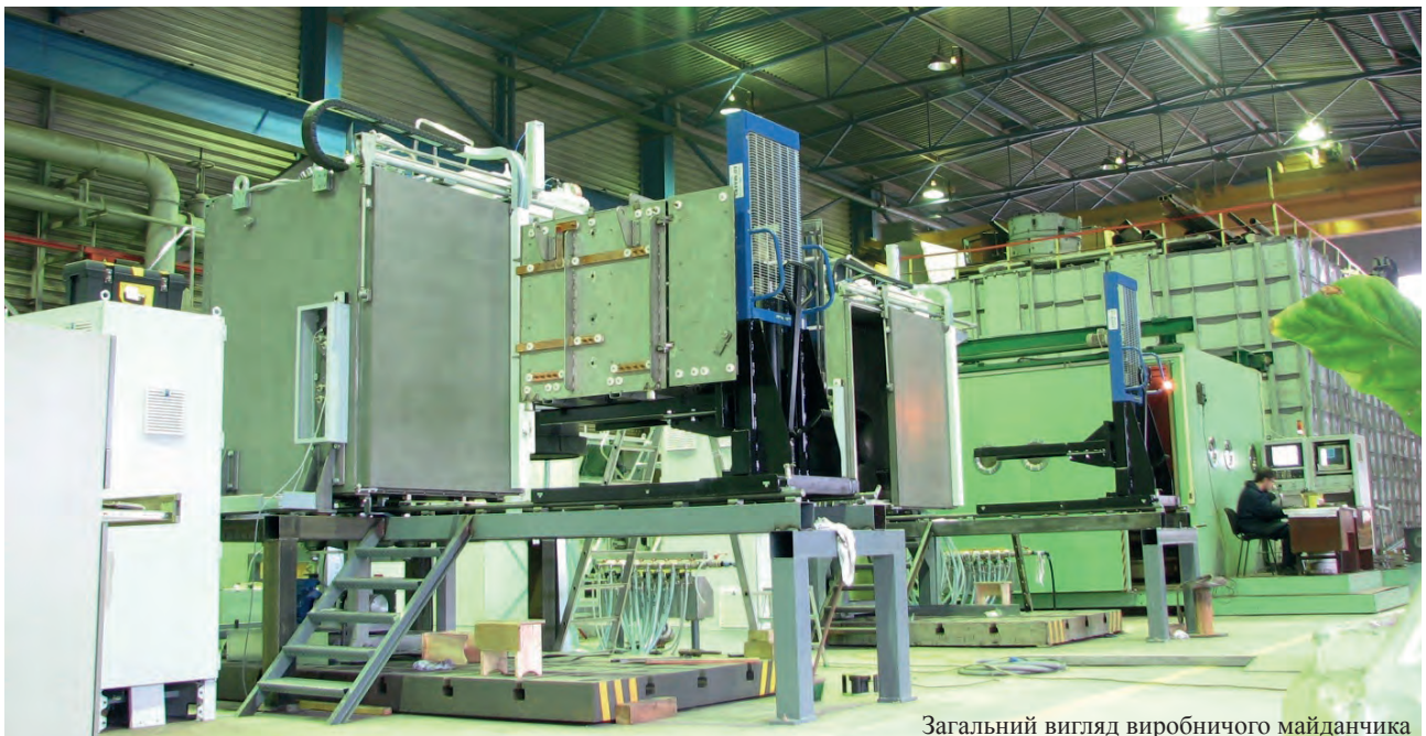
Загальний вигляд виробничого майданчика

Всі розроблені та поставлені відділом установки можна розділити на декілька типів за об'ємом зварювальної камери: «малі», «середні», «великі» та «надвеликі». При цьому характерною рисою установок, розроблених для ЕПЗ великогабаритних деталей, є внутрішньокамерна мобільна електронно-променева гармата, що має від 3 до 5 ступенів свободи та точність позиціонування не гірше 0,08 мм. Це, безумовно, дозволяє макси-