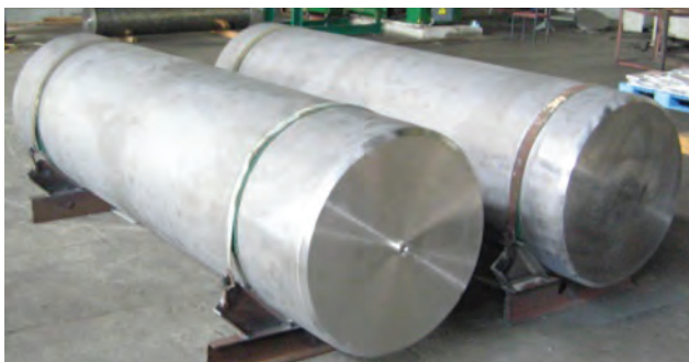
Зливки жароміцного титанового сплаву ВТ3-1 діаметром 840 мм та довжиною 3000 мм

Подальші дослідження показали, що сплав СП15 має комплекс характеристик, що дозволяють застосовувати його не тільки у вигляді зварю-