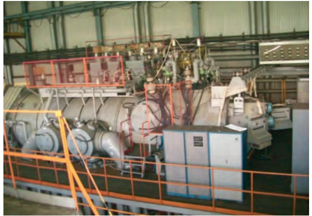
Електронно-променева установка для виплавки титанових зливків діаметром до 1100 мм та масою до 20 т

вального дроту. У литому стані сплав СП15 за показниками міцності і пластичності перевищує усі відомі ливарні сплави. Тому він дуже ефективний для великогабаритного фасонного литва, зокрема силових елементів виробів відповідального призначення. Не менш важливою особливістю сплаву СП15 є його висока корозійна стійкість в агресивних середовищах, що перевищує стійкість технічного титану, міцність якого вдвічі нижче, ніж сплаву СП15. Тому сплав СП15 є дуже ефективним і для хімічного машинобудування.