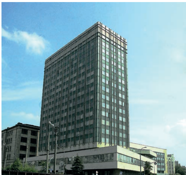
Новий корпус ІЕЗ (роки роботи 1975–2020)

повсякденності, побутовості, це розсування горизонтів вусібіч. В одній з праць французького астронома Каміля Фламмаріона вперше з'явилася знаменита нині гравюра невідомого автора, яка, по-моєму, геніально передає суть науки: на ній зображено людину, яка зазирає за межі небесної сфери — у відкритий космос. Вона не отримує від цього миттєвої практичної користі, крім хіба суто професійного задоволення, але не може інакше.