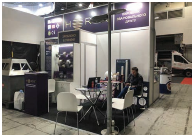
Стенд компанії «ВІТАПОЛІС»

Товариство зварників України провело XV відкритий конкурс зварників «Золотий кубок Бенардоса–2021». Ця яскрава, жива, динамічна подія покликана підвищити престиж професії зварювальника з особливим духом змагання та почесними кубками переможцям. Учасники здобули емоції, нагороди, мотивацію рухатися далі до наступних перемог!