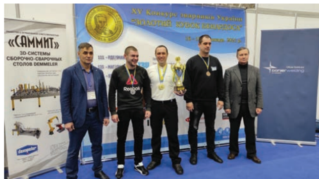
Переможці XV відкритого конкурсу зварників «Золотий кубок Бенардоса–2021»