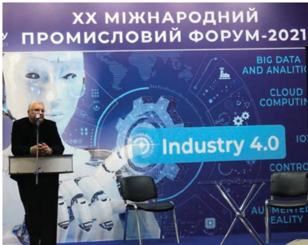
Доповідь М.А. Яременка, ІЕЗ ім. Є.О. Патона