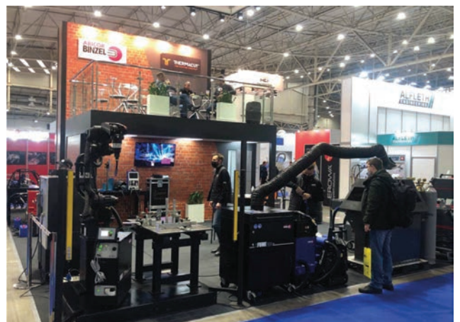
На стенді компанії «БІНЦЕЛЬ УКРАЇНА ГМБХ»

ститут електрозварювання ім. Є.О. Патона НАН України, Київ);