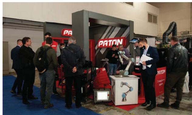
Стенд компанії «ПАТОН ІНТЕРНЕСНЛ»

ЛИТТЯ. Цьогорічна виставка «УкрЛиття» була значно розширена. Провідні компанії в галузі ливарного виробництва презентували повний пакет