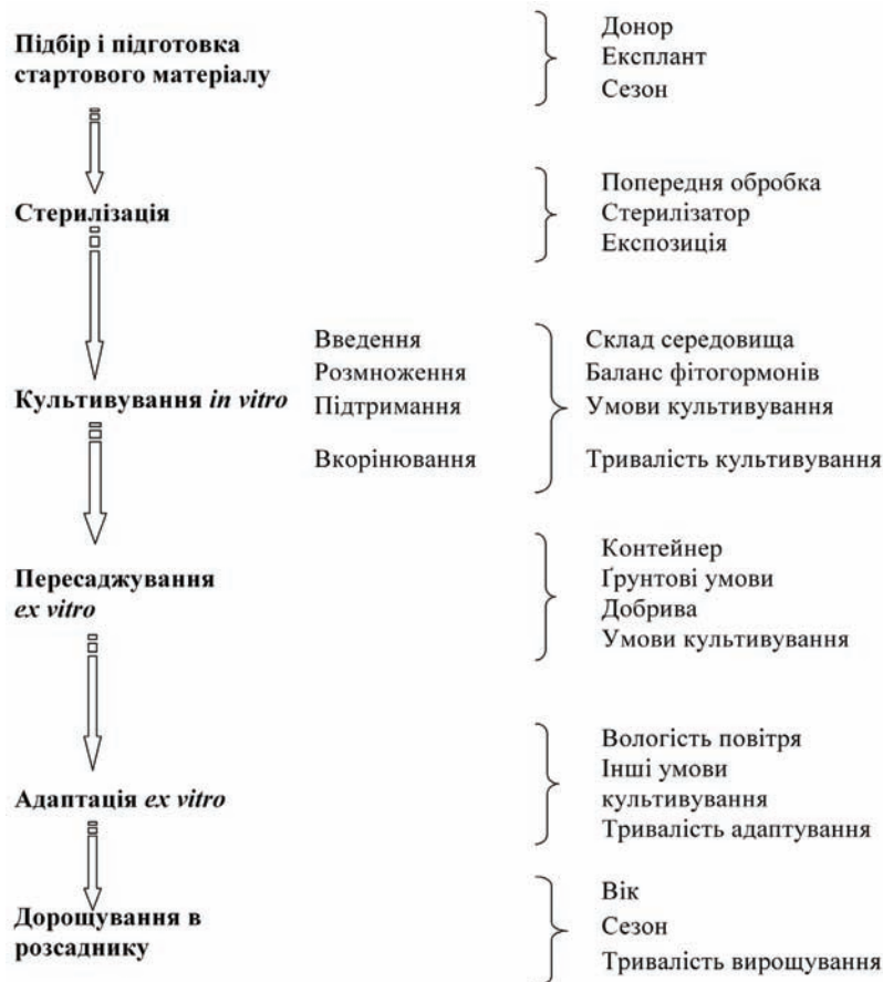
Рис. 1. Етапи мікроклонального розмноження і чинники результативності

більш важливі для країн, у яких проводилися дослідження, види [35, 37, 38, 53, 55, 64–66, 72, 78, 83].