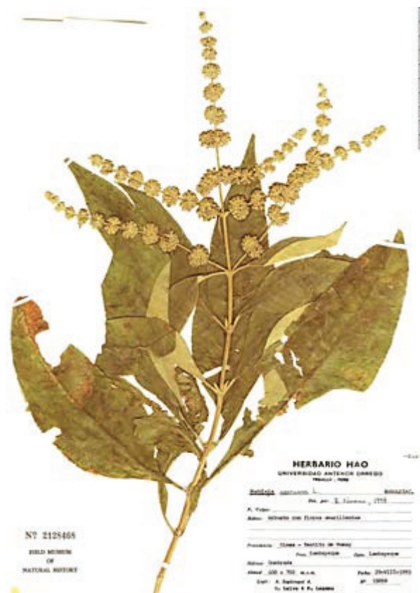
Рис. 2. Buddleja americana L.