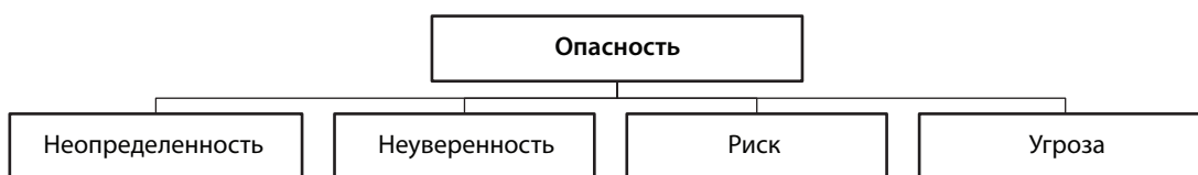
Рис. 1. Виды опасностей для предприятия