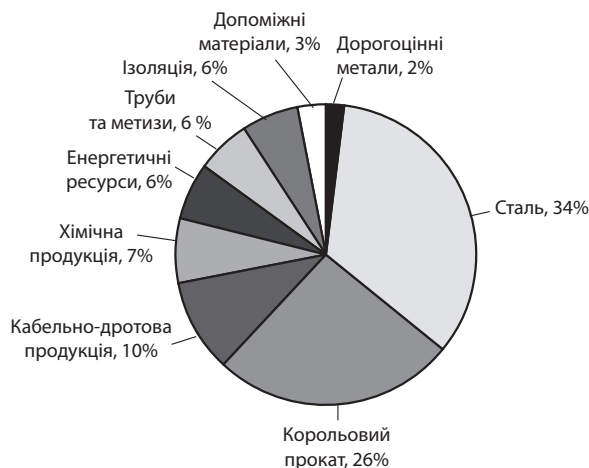
Рис. 1. Структура матеріальних ресурсів машинобудівного підприємства

Структура матеріальних ресурсів представлена на прикладі одного з машинобудівних підприємств Харківщини (рис. 1).