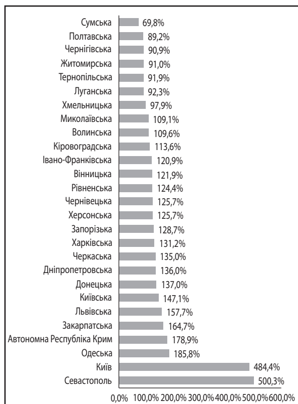
Рис. 2. Рівень забезпеченості торговими закладами регіонів України