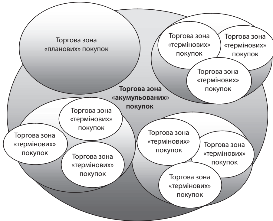
Рис. 1. Розподіл торгових закладів на формати залежно від часу, який споживачі витрачають на здійснення покупок, та мотиву їх відвідування

Проте значне відставання у задоволенні потреб сільських жителів у кількості торгових закладів для здійснення термінових покупок, потребує розробки та впровадження загальнодержавної програми для вирішення даної проблеми. ■