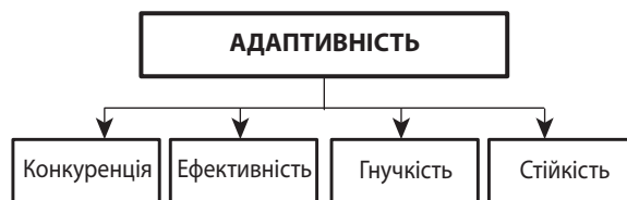
Рис. 1. Складові адаптивності підприємства

Більшість українських фахівців, так і зарубіжних авторів кажучи про гнучкість, адаптивності та ефективності називають їх синонімами. У сучасних умовах виникла необхідність у відокремленому розгляді цих понять, оскільки адаптивне підприємство відрізняється від стійкого тим, що має постійно функціонувати у динамічному оточенні, знижувати або підвищувати показники, а стійкий - в першу чергу, це постійне підприємство. Ефективна діяльність підприємства полягає в досягненні прибутку, а адаптивна діяльність - це пристосування з метою отримання прибутку в умовах динаміки. Доцільно надалі говорити про новий дослідженні в економіці - гнучкої адаптації. Підприємство з гнучкою адаптацією має з максимальною швидкістю, а значить з миттєвою реакцією, пристосуватися до змін у навколишньому середовищі з найменшою зміною поточних параметрів діяльності.