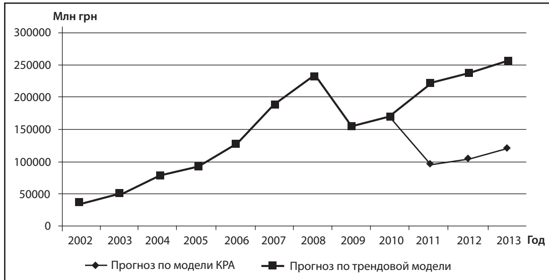
Рис. 2. Динамика и сценарии развития процесса инвестирования в основной капитал Украины на 2011 – 2013 гг.

При увеличении степени износа основных фондов на 1% происходит увеличение объема инвестиций в основной капитал на 0,012%, что говорит о низкой привлекательности инвестирования в устаревшее оборудование.