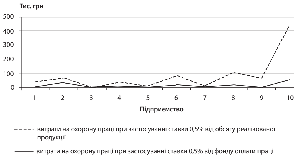
Рис. 1. Фінансування витрат на охорону праці (варіант 1 і варіант 2)