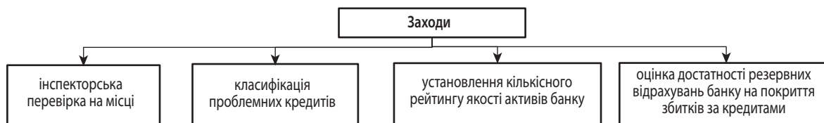
Рис. 2. Заходи, спрямовані на визначення якості активів банку

Завершальним компонентом оцінки системи CAMEL є підсистема оцінки рівня ліквідності. Важливо пам'ятати, що для управління ліквідністю банк повинен виконувати свої зобов'язання, не маючи при цьому втрат. Банки повинні мати в розпорядженні ліквідні активи, які легко можуть бути конвертовані в наявні кошти, або вміти оперативно залучати кошти на першу вимогу для того, щоб виконати свої зобов'язання.