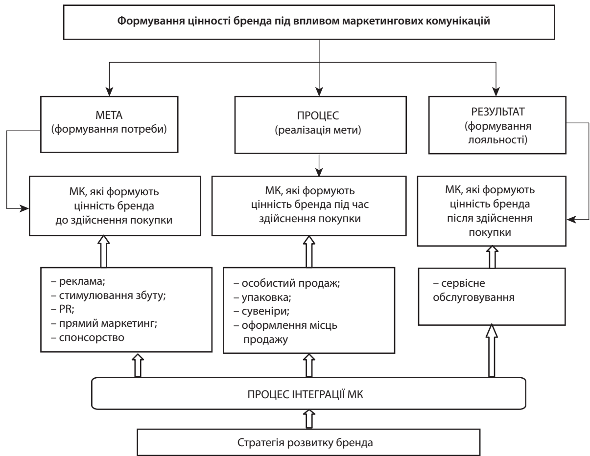
Рис. 1. Формування цінності бренда під впливом маркетингових комунікацій