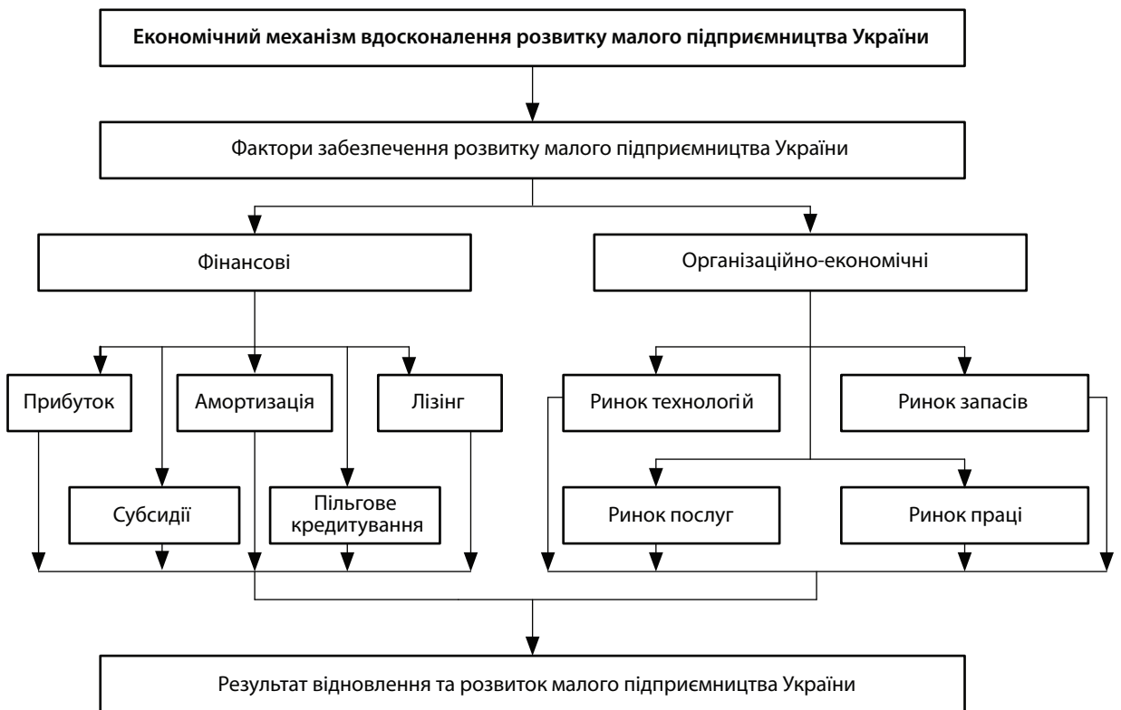
Рис. 2. Економічний механізм відновлення та розвитку малого підприємництва України