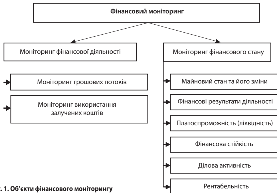
Рис. 1. Об'єкти фінансового моніторингу