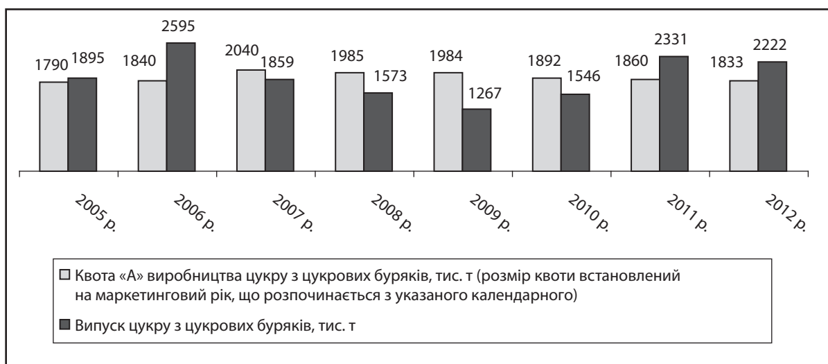
Рис. 1. Забезпечення потреби внутрішнього ринку України цукром вітчизняного виробництва (квота «А»)

На вимогу Світової організації торгівлі Україна «позбавила себе права» на експорт цукру, виключивши із Закону України «Про державне регулювання виробництва і реалізації цукру» положення про встановлення квоти «В» (граничний розмір поставки цукру за межі України за міжнародними договорами) і «С» (цукор, вироблений понад квоти «А» і «В» і призначений для реалізації виключно за межами країни). Єдиний і останній раз квота «В» була встановлена на 2006/07 (Постанова Кабінету Міністрів України «Про заходи щодо державного регулювання виробництва і реалізації цукру та цукрових буряків» від 20 лютого 2006 р. № 171). Проте 30 листопада 2006 р. був прийнятий Закон України «Про внесення змін до Закону України «Про державне регулювання виробництва і реалізації цукру» № 403-V, який