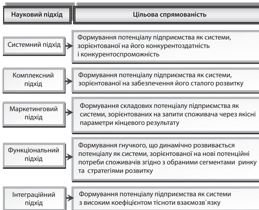
Рис. 3. Наукові підходи до формування потенціалу як системи (складено авторами за [14])

Важливою характеристикою процесів розвитку систем є час: по-перше, будь-який розвиток здійснюється в реальному часі, по-друге, тільки часовий фактор виявляє спрямованість розвитку [15].