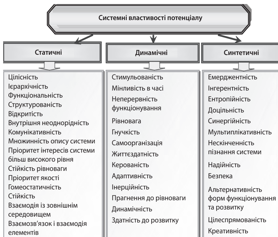
Рис. 4. Угрупування системних властивостей потенціалу (складено авторами)

державної академії залізничного транспорту. – Х. : УДАЗТ, 2011. – Вип. 36. – С. 23 – 26.