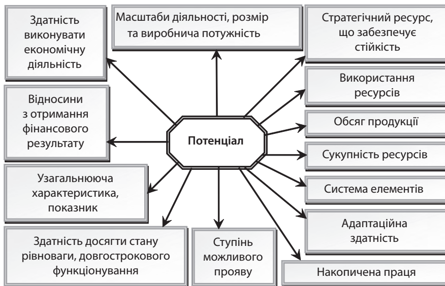
Рис. 1. Групування наукових поглядів на визначення категорії «потенціал» (складено авторами за [7])