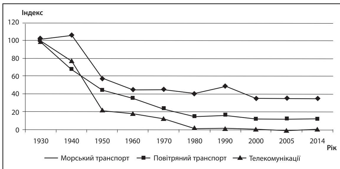
Рис. 1. Витрати на комунікації та транспортні витрати за 1930 – 2014 рр. [30]

3. Торговельні тарифи. Глобалізація прискорюється також завдяки зниженню торговельних тарифів, оскільки вони сприяють міжнародній торгівлі. У світі сьогодні більше 95% товарів на світовому ринку продаються та придбаваються відповідно до правил Світової організації торгівлі (СОТ), членами якої є 160 країн світу (з 26 липня 2014 р. після приєднання Ємена) [29] і яка створена з метою лібералізації міжнародної торгівлі й регулювання торговельно-політичних відносин держав-учасниць.