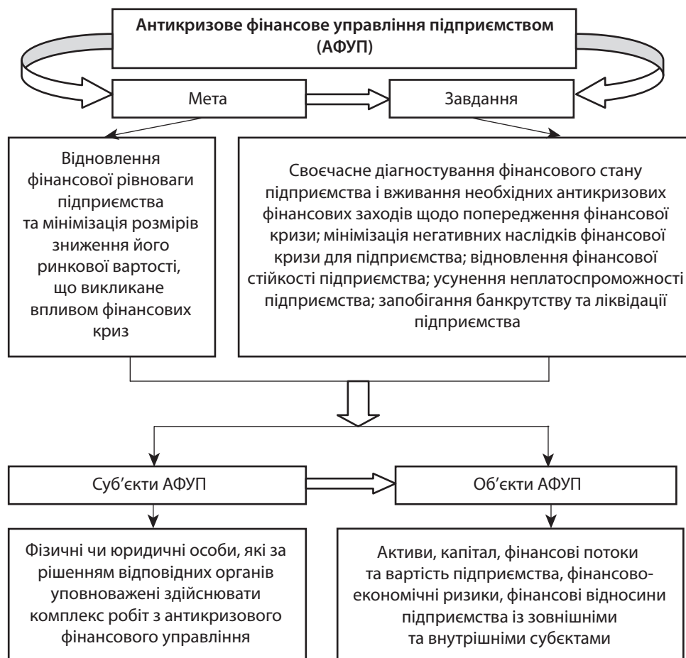
Рис. 1. . Зміст основних елементів АФУП

До суб'єктів АФУП слід віднести осіб, що мають повноваження, надані відповідними органами щодо здійснення комплексу антикризових заходів (фінансовий менеджер, керівник підприємства, керуючий санацією, арбітражний керуючий, ліквідатор тощо).