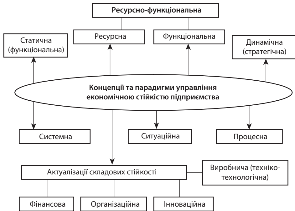
Рис. 1. Основоположна база формування концепцій та парадигм управління економічною стійкістю суб'єкта господарської діяльності

ня як комплекс взаємопов'язаних ресурсів із різним рівнем впливу кожної складової на загальну довгострокову стійкість економічної одиниці.