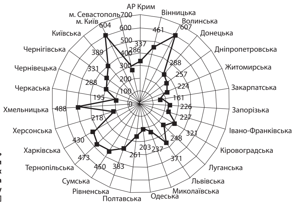
Рис. 1. Забезпеченість населення посадковими місцями в об'єктах ресторанного господарства в 2012 р. (на 10 тис. осіб у розрізі областей) [7, с. 108]

Слід наголосити на нерівномірності забезпечення населення посадковими місцями ресторанного господарства в розрізі окремих регіонів. Найвищим рівнем відзначаються м. Київ (604 од.), Волинська (607 од.), Хмельницька (488 од.), Тернопільська (473 од.) області, а найнижчим – Закарпатська (161 од.), Черкаська (195 од.), Одеська (203 од.) та Херсонська (218 од.) області (рис. 1).